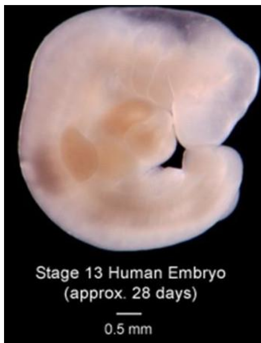
Slika 2. Embrij sedam tjedana nakon začeća (25)

Poslije prvih 8 tjedana trudnoće, pa sve do poroda plod prelazi iz faze embrija u fazu ploda ili fetusa. Fetus u korijenu naziva znači nerođeno potomstvo. Tijekom fetalnog razdoblja tijelo ploda raste i organizam počinje funkcionirati. U devetom tjednu trudnoće plod je velik oko dva centimetra i počinje sve više nalikovati na čovjeka. Deseti tjedan obilježen je razvojem spolnih organa kod ploda. Plod može savijati ruke i noge, što mu omogućuje kretanja. Oko desetog tjedna moguća je upotreba doplera pomoću kojeg je omogućeno slušanje otkucaja srca kod ploda. Maternica trudnice dolazi na veličinu muške šake i ispunjava malu zdjelicu. Kod majke odvija se prilagodba bubrežnog i dišnog sustava.