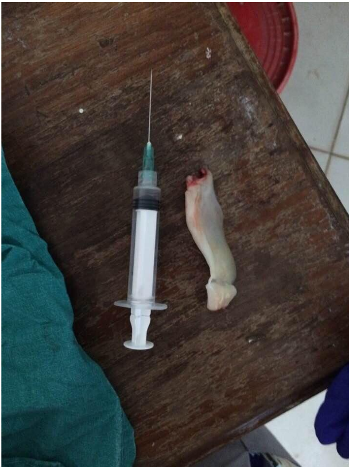
Slika 5. Odvajanje pupkovine od posteljice iglom, LHCC, Arusha, Tanzania