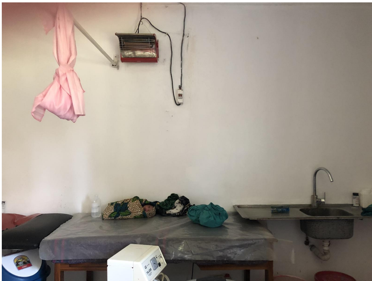
Slika 6. Rađaona, stol za novorođenčad u LHCC-u, Arusha, Tanzania

Odmah nakon poroda dijete se umata u maramu koju je sa sobom u bolnicu donijela majka. Prva opskrba novorođenčeta sastoji se od brisanja, sušenja i utopljanja djeteta. Nakon umatanja dijete se stavlja na digitalnu vagu te mu se mjeri tjelesna težina. Dijete ne prima nikakve lijekove, cjeviva, kapi niti se zbrinjava pupkovina.