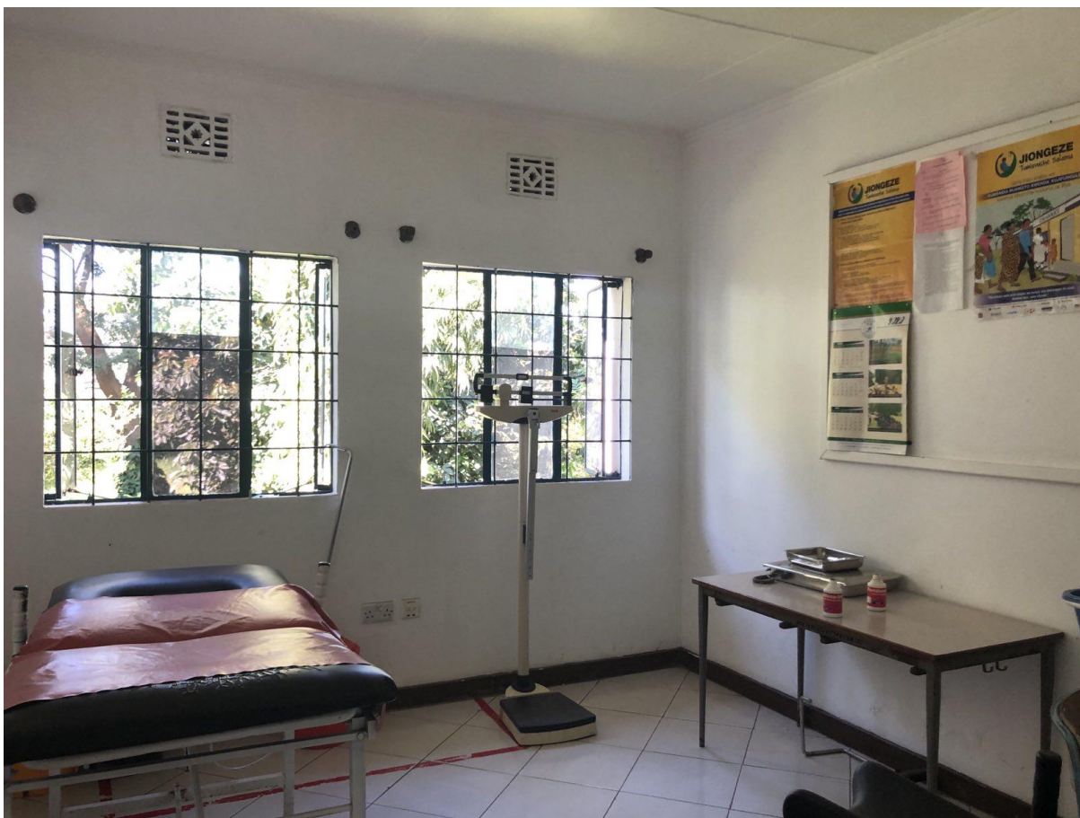
Slika 2. Prijemna ambulanta u LHCC-u, Arusha, Tanzania

Kod prijema se obavlja vaginalni pregled, određuje se namještaj i položaj ploda Leopold – Pavlikovim hvatovima (LP hvatovi), mjeri se tlak, tjelesna težina, udaljenost fundusa i simzife te opseg trbuha. KČS slušaju se Pinardovom slušalicom.