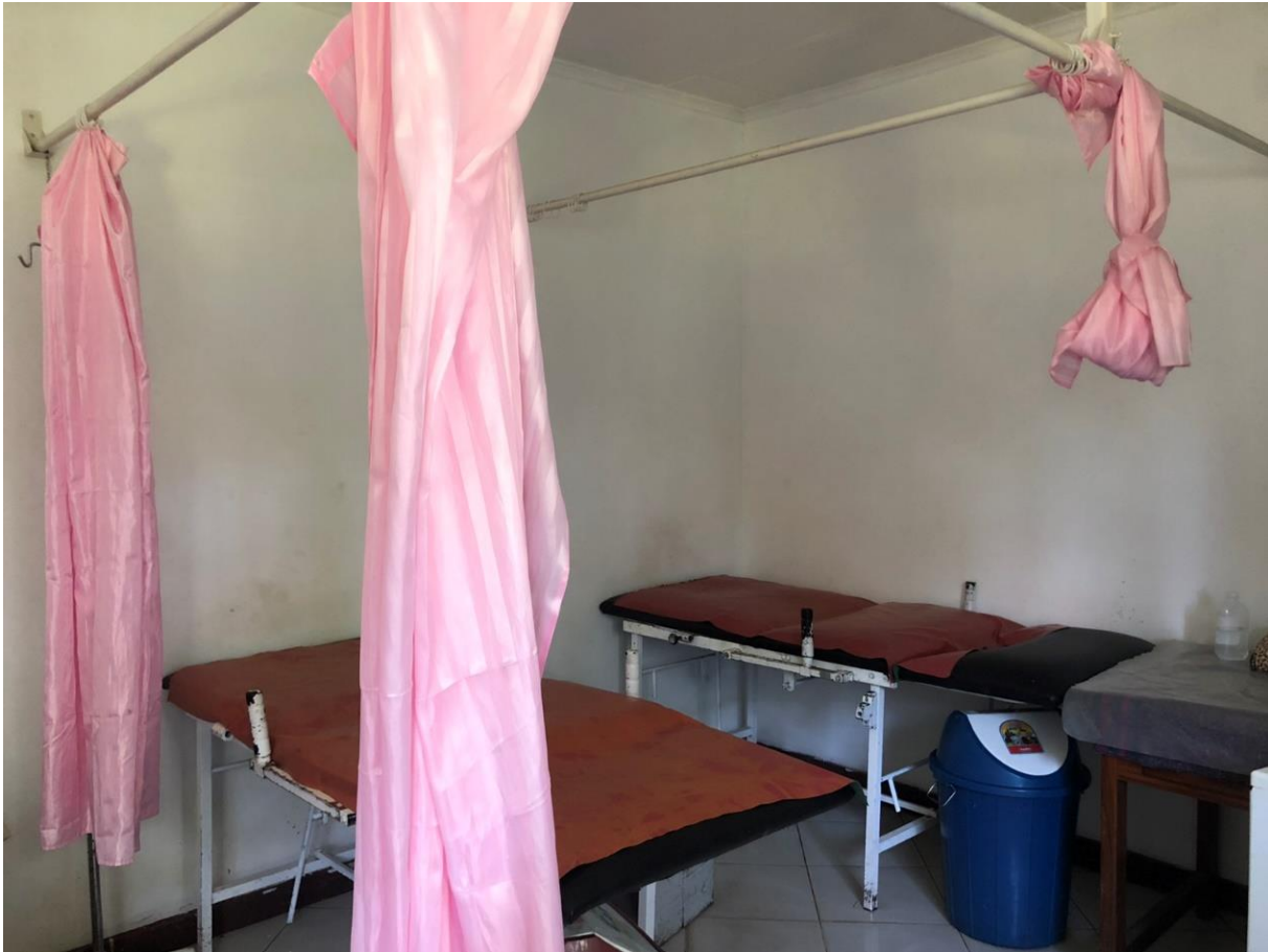
Slika 4. Rađaona u LHCC, Arusha, Tanzania