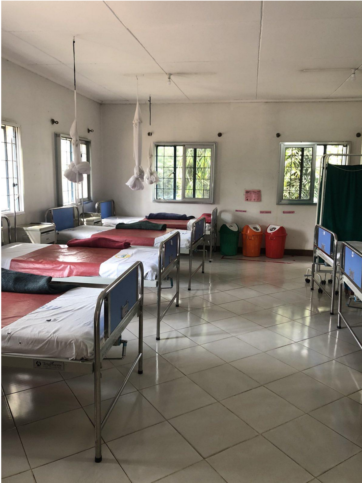
Slika 9. Postoperacijska jedinica u LHCC-u, Arusha, Tanzania