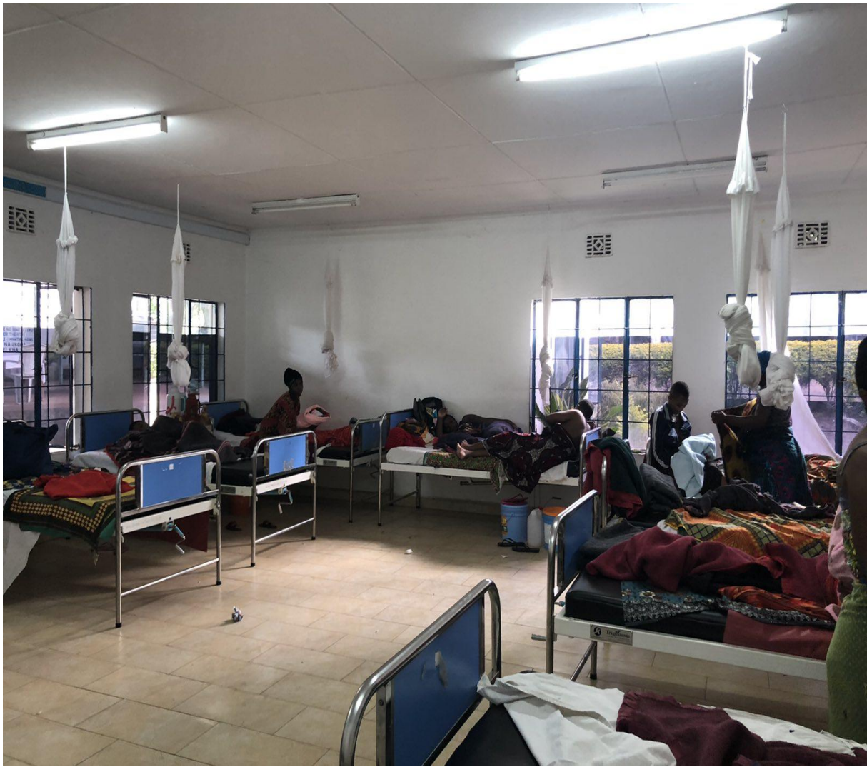
Slika 8. Rodilište u LHCC-u, Arusha, Tanzania