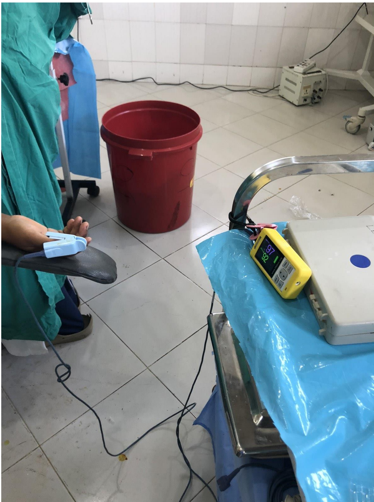
Slika 7. Monitoring u operacijskoj sali tijekom S.C., Arusha, Tanzania