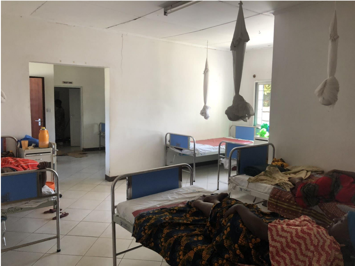
Slika 3. Predrađaonica u LHCC, Arusha, Tanzania