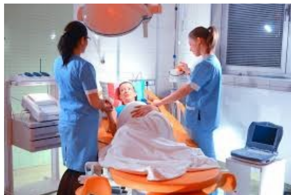
Slika 2. Prikaz trudnice u rađaoni

Najčešće pogreške i uzroci odstupanja od etičnosti skrbi je rutinizacija prakse, otpor promjenama, administracija i nedostatak osoblja. Usmjerenost na monitoring, medicinsko tehničke postupke, postojeći problem i nedostatak komunikacije s roditeljom, stvara hladni odnos, narušava diskreciju, uzrokuje nedostatak empatije i povećava strah i anksioznost kod događaja koji je sam po sebi već stresan. Stoga, važno je prepoznati rutinizaciju prakse i svjesno djelovati na njeno smanjenje.