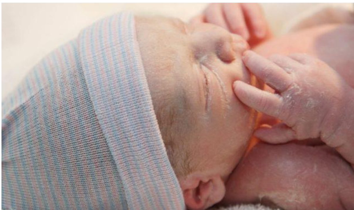
Slika 1. Zdravo novorođenče

Novorođenče rođeno prije navršenih 37 tjedana naziva se prematurno novorođenče. Nakon navršena 42. tjedna gestacije novorođenče se naziva prenešeno novorođenče ili postmaturus.(2)