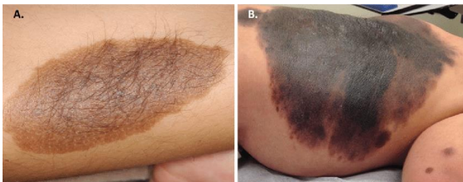
Slika 6. Kongenitalni pigmentirani nevus

Veliki prirodni nevusi mogu narasti i preko 20 cm. Povezani su s povećanim rizikom od nastanka melanoma. Maligno alteriraju između 3-15 godina života. Veliki nevusi se ne mogu iruški odstraniti i bitno ih je dobro pratiti. U praksi je da se kod velikih nevusa radi češća magnetska rezonancija ili CT koji prati te nevuse. Prirodni nevusi koji su manjih promjera isto mogu biti povezani s malignim promjenama.(9)