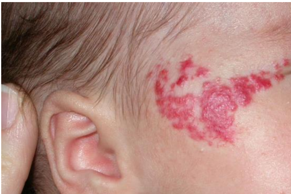
Slika 5. Hemangiom u području oko očiju

Podvrsta hemangioma koji se nalazi na područjima poput vrha nosa mogu puno sporije prolaziti. Manja skupina hemangioma potpuno je formirana po porodu. Većina kongenitalnih hemangioma nestaje za 12-18 mjeseci. Oni se očituju kao benigni tumori. Lezije koje se nalaze u blizini anusa, uretre, dišnih puteva i oka rijetko mogu urožavati vitalne funkcije. Oni hemangiomi koji se nalaze u području oko oka mogu biti povezani sa slabovidnošću (slika 5). (3)