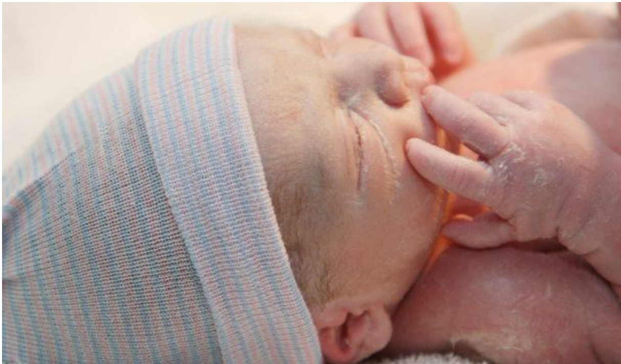
Slika 1. Zdravo novorođenče

Novorođenče rođeno prije navršenih 37 tjedana naziva se prematurno novorođenče. Nakon navršena 42. tjedna gestacije novorođenče se naziva prenešeno novorođenče ili postmaturus.(2)