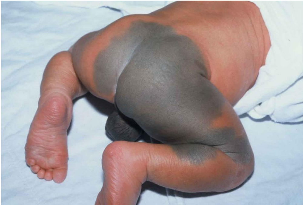
Slika 4. Mongolska pjega

nakupljanja melanocita u dermisu zbog povećanog transdermalnog prijelaza iz neuroektoderma u ektoderm. Mongolska pjega se puno češće javlja kod novorođenčadi koja su tamnije puti, mada se može naći i kod djece koja su svijetle puti. S godinama života postaje sve blijeđa do toga da potpuno nestane. (13)