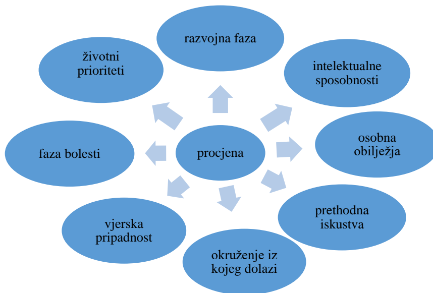
Slika 1 Čimbenici koju su uključeni u procjenu potreba za edukacijom

U procjeni potreba pojedinog pacijenta ili grupe pacijenata koji imaju podjednake zdravstvene probleme, mogu se koristiti različite metode. Te metode se mogu odnositi na intervjuiranje pacijenata ili članova njihove obitelji koje može biti po potrebi vođeno strukturiranim upitnikom. U nju se mogu uključiti i suradnici iz zdravstvenog tima.(33) Općenita i otvoreno/zatvorena pitanja, razumijevanje faktora iz okoline (npr. nemogućnosti redovnih kontrola, kulturološka uvjerenja i sl.) i pristtnost barijera za učenje važne su za izradu plana edukacije. (41) Čimbenici koji uvjetuju potrebe za edukacijom i spremnost na učenje prikazani su na slici 1.