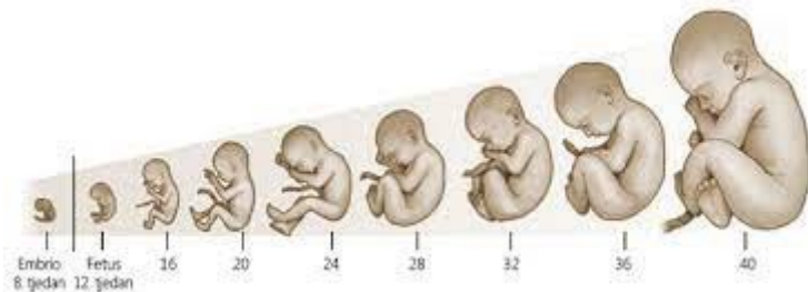
Slika7. Razvoj fetusa po tjednima trudnoće

Pravo na život ima svako živo biće. Crkva smatra da svi moraju poštovati petu zapovjed „Ne ubij“. Začeti plod u majci ima pravo da bude prihvaćeno i rođeno. Često se vode rasprave da je žena ta koja učini prekid trudnoće i sprječi nastanak novog života. Za začecje je potreban i muškarac koji često izbjegava odgovornost i želi se osloboditi svake krivnje.