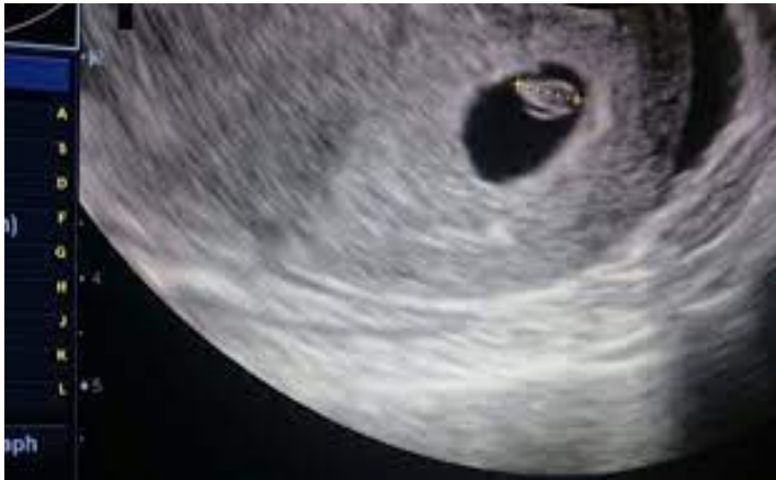
Slika1. Prikaz ultrazvučne slike u 6-tom tjednu trudnoće

Određivanje gestacijske dobi od prvog dana posljednje menstruacije kod žena sa redovitim menstrualnim ciklusima. Gestacijska dob može se utvrditi ultrazvučnim pregledom. Sa 6 tjedana ultrazvučnom metodom vidljiva je fetalna srčana akcija, koja se u 8 tjednu trudnoće 95% potvrditi. Prvih 12 tjedana trudnoće naziva se prvo tromjesječe trudnoće. Vrijednostima beta HCG-a iz krvi dokazuje se rana trudnoća. Kod normalne trudnoće razina HCG-a i progesterona sa sigurnošću potvrđuju urednu trudnoću.