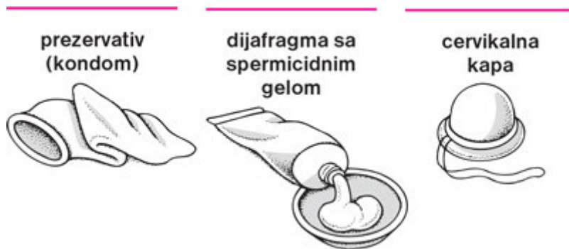
Slika4. Mehanička kontracepcija za zaštitu od neželjene trudnoće

POLIURETANSKA VREĆICA – prije početka odnosa postavlja se u vaginu (kemijska i mehanička zaštita).