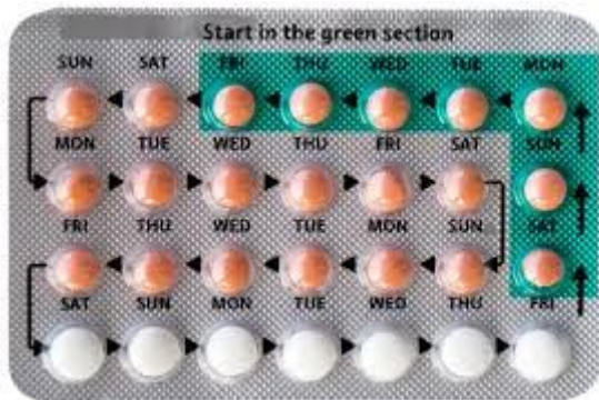
Slika5. Oralna hormonska kontracepcija

HITNA KONTRACENCIJA – koristi se drugi dan od nezaštićenog spolnog odnosa kako bi se spriječila trudnoća. Ovaj oblik kontracepcije preporučava se ženama koje dolaze u hitnu ambulantu radi silovanja. Ako se trudnoća već dogodila primjena tablete neće imati nikakav učinak. Tableta može uzrokovati povraćanje, jake bolove u trbuhu, mučninu i vrtoglavice. Hitna kontracepcija se može kupiti u ljekarnoj, te nije potreban recept od strane nadležnog liječnika. Ne preporučava se kao zaštita od trudnoća kao stalna metoda.