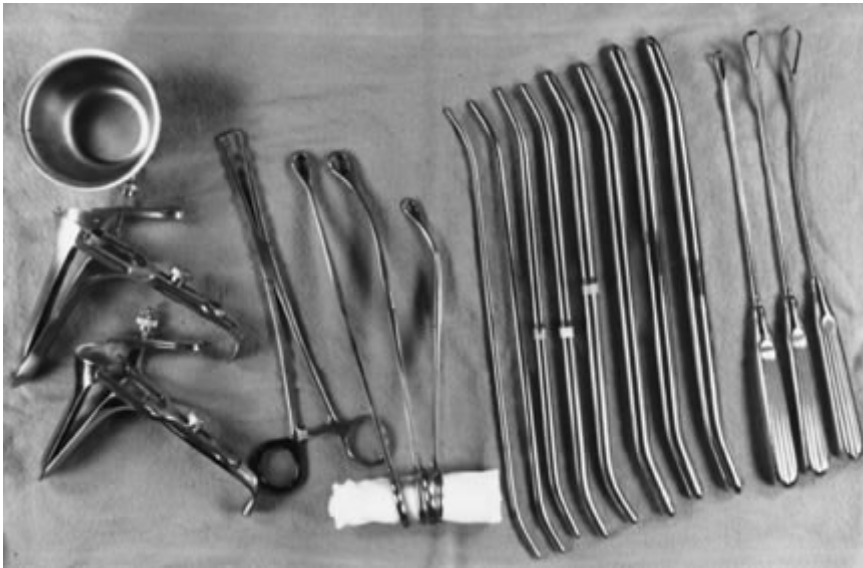
Slika3. Potrebni instrumenti za izvođenje kiretaže kod pobačaja