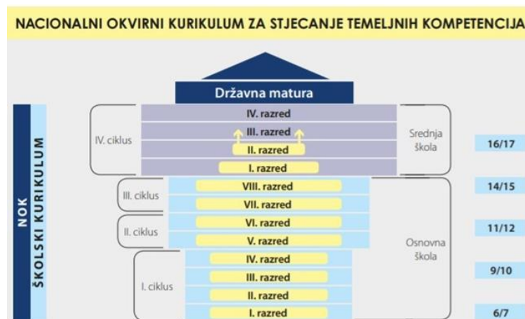
Slika1. Odgojno-obrazovni ciklusi za stjecanje temeljnih kompetencija

Na snagu je stupio 2011. godine „Nacionalni okvirni kurikulum (NOK) za područje predškolskog odgoja i obrazovanja te opće obvezno i srednjoškolsko obrazovanja“. Njegova osnovna kvaliteta ogleda se u tome što je osigurao da se svi sastavni dijelovi sustava povežu u jednu skladnu cjelinu (8). Osnovna karakteristika ovog kurikuluma je prijelaz težišta s nastavnih sadržaja na postignuća učenika (ishode učenja). Ishodi učenja jasno i konkretno definiraju što se želi postići nastavom odnosno opisuju što učenik mora naučiti (znanje, vještine, stavovi). Nakon uspješnog savladavanja programa predmeta, učenik će znati obavljati određene aktivnosti na društveno prihvatljivoj razini (8). Pod kompetencijama podrazumijevamo mogućnost osobe da stečene vještine i znanja iskoristi u praksi te time poboljša svoj osobni i profesionalni razvoj. Jedan takav primjer jesu kompetencije odgovornosti i samostalnosti koje se smatraju osnovnim odgojnim kompetencijama (9).