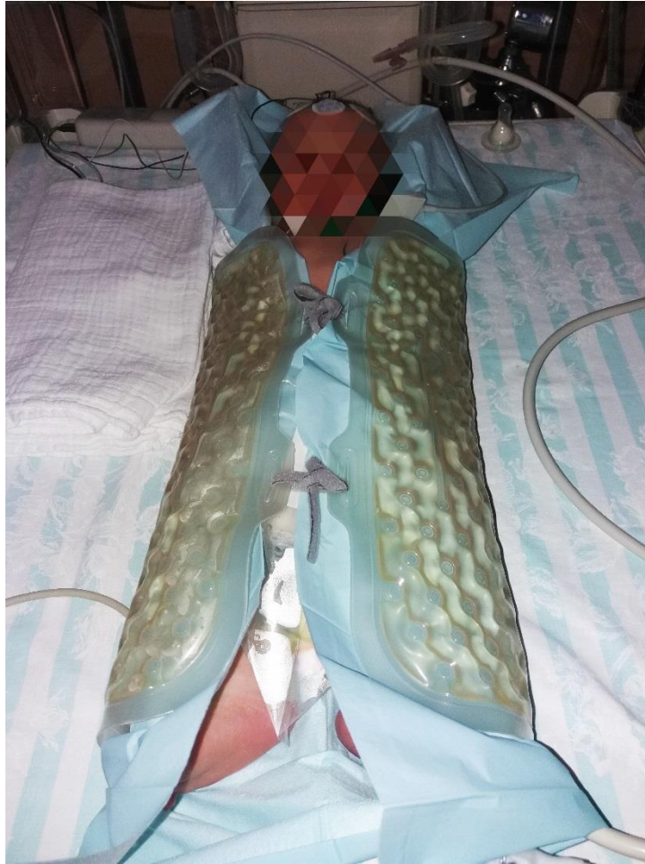
Slika broj 5: CritiCool uređaj