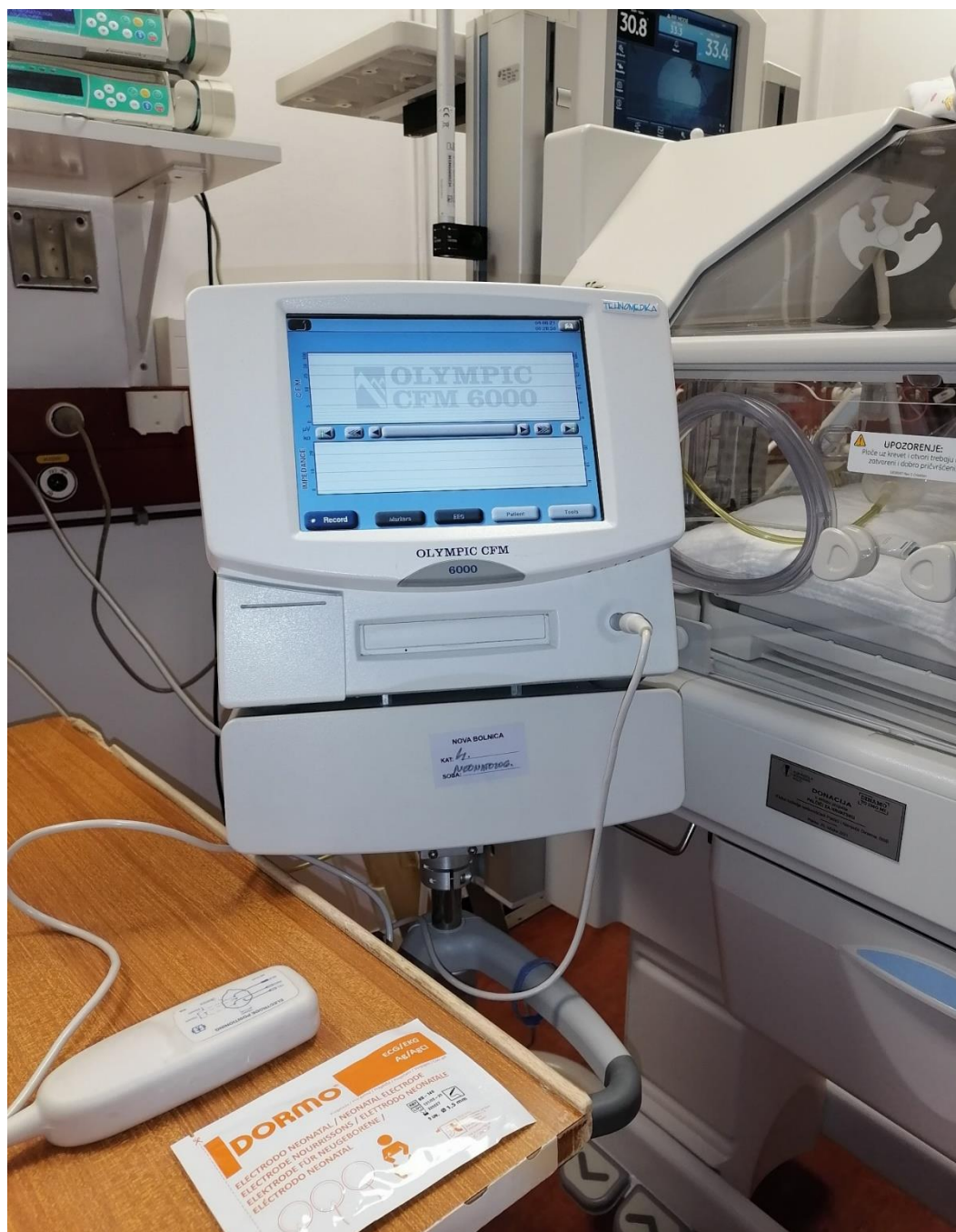
Slika br.4:CFM MONITOR