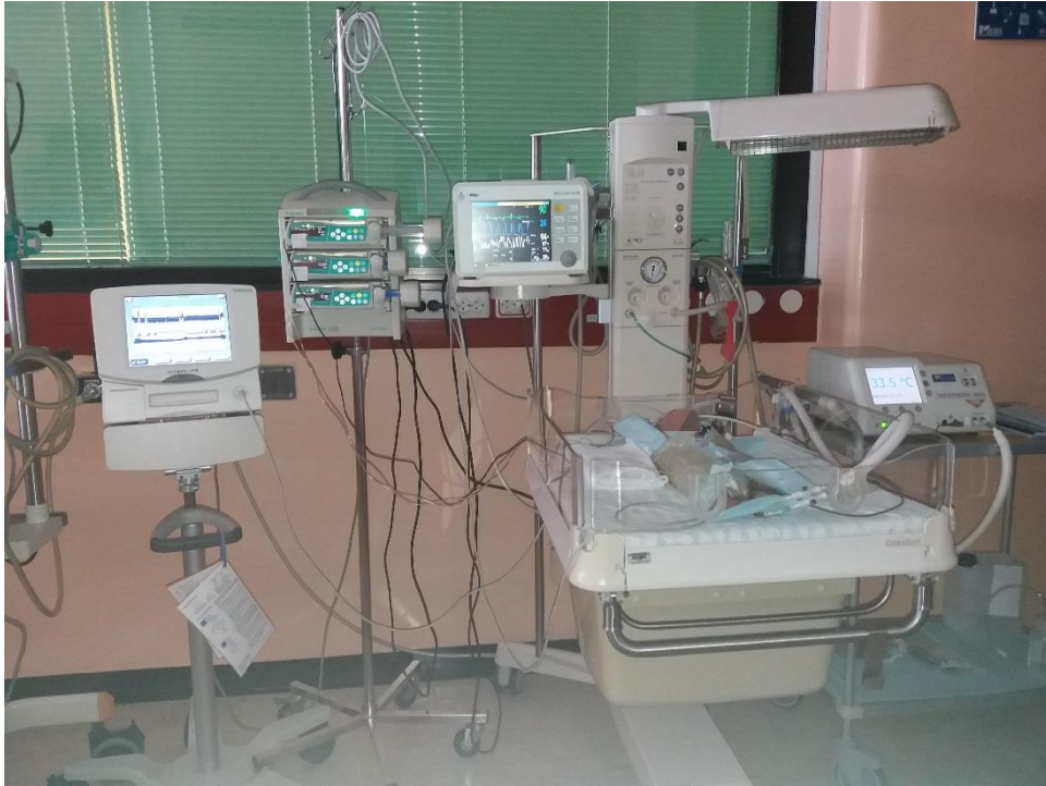
Slika broj 6: Cjelokupna oprema uključena u postupak liječenja terapijskom hipotermijom.