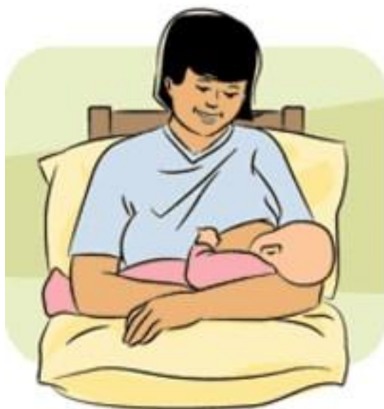
Slika 3. Položaj koljevke

Pri položaju koljevke se dijete drži u naručju, no pritom ruka mora biti rasterećena, tj oslonjena na jastuk. Ako dijete siše na desnoj dojci, položeno je na desnu ruku i obrnuto. Leđa također moraju imat dobar oslonac kako bi se izbjegli bolovi, nije potrebno savijanje prema naprijed ni prema nazad (osim prilikom snažnog refleksa otpuštanja mlijeka). Dijete mora biti cijelom ravninom okrenuto prema majci, a ne samo glava.