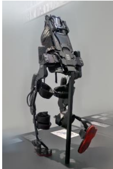
Slika 12. Ekso-GT

karbonskih vlakana i koristi hidraulički sustav napajanja. Ovaj egzoskelet pričvršćuje se bilateralno za donje ekstremitete i ima električno pokretane zglobove kuka i koljena te pasivnu artikulaciju gležnja s oprugom koja podržava odmicanje nožnih prstiju i razmak stopala putem podnožja. Senzori su ugrađeni u naramenice koje pristaju oko tijela korisnika, a koji reagiraju na mišićni učinak korisnika. Ekso radi u više načina ovisno o razini pomoći koja je potrebna pacijentu, a također trenira prijelazne pokrete kao što su sjedenje u stajanje i stajanje u sjedenje (39, 40).