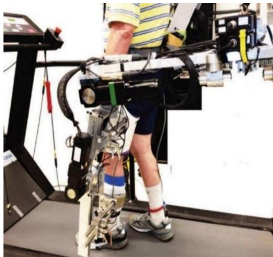
Slika 8. ALEX

Fakultet strojarstva, Sveučilište Delaware, razvio je robota za aktivno hodanje pod nazivom ALEX (Slika 8.). Sastoji se od pomične konzole, egzoskeletne ortoze donjih ekstremiteta i upravljačkog sustava. Svaka noga ima četiri stupnja slobode, dva stupnja slobode kuka i jedan stupanj slobode koljena i skočnog zgloba. Leđa ALEX -a, koristeći mehanizme za uravnoteženje gravitacije ljudskog tijela, mogu pomoći pacijentima u postizanju ravnoteže (21).