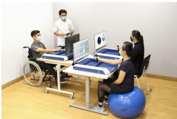
Slika 1. H-Man

H-Man (Slika 1.) je karakteriziran mehaničkim dizajnom temeljenim na kabelskom diferencijalnom prijenosu koji pruža prednosti u odnosu na trenutnu robotsku tehnologiju. Prijenos H-Man znači krajnje pojednostavljenu kinematiku i homogena dinamička svojstva, nudeći mogućnost generiranja haptičkih kanala pasivnim blokiranjem mehanike i eliminirajući probleme vezane uz stabilnost (18). Mehanički dizajn H-Mana pruža mogućnost brzog stvaranja haptičkih kanala pomoću mehaničkih čepova (na jednom od motora). H-Man je uređaj za proučavanje motoričke kontrole i robotsku rehabilitaciju. Hardver je dizajniran s posebnim naglaskom na mehaniku koja rezultira sustavom koji je jednostavan za upravljanje, homogen je i koji je intrinzično siguran za upotrebu (19).