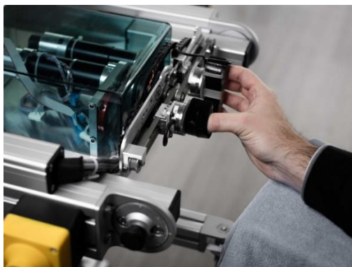
Slika 5. ReHaptic Knob