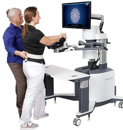
Slika 2. In Motion arm/hand robot