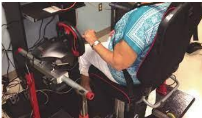
Slika 11. TheraDrive

Haptic TheraDrive (Slika 11.) je robot s jednim stupnjem slobode za rehabilitaciju nakon moždanog udara. Korisnik upravlja TheraDriveom manipulirajući okomito postavljenom ručkom opremljenom sensorima sile i optičkim koderom. Za potrebe procjene, radi u načinu kompenzacije gravitacije (21).