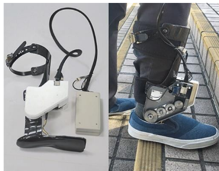
Slika 13. Ankle Robot