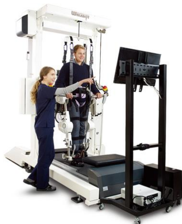
Slika 10. Walkbot-G