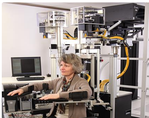
Slika 6. Kinarm

Kinarm Exoskeleton (Slika 6.) koristi složenu vezu kako bi omogućio pokrete ruke u vodoravnoj ravnini uključujući pokrete fleksije i ekstenzije u zglobovima ramena i lakta. Momentni motori bilježe kretanje ruke u vodoravnoj ravnini i primjenjuju opterećenja na svaki zglob neovisno. Dizajn pruža povratnu informaciju od zglobova ramena i lakta i kontrolu nad njima, čime se dopušta primjena opterećenja na zglobove ramena i/ili lakta (ili opterećenja temeljena na rukama). Bilježe se uzorci pokreta zglobova; mišićne momente izračunava sustav. Svaki Kinarm robot može se koristiti kao egzoskelet za rame i lakat (ostavljajući ruku slobodnom za interakciju s objektima u okolini) ili se može pretvoriti u krajnjeg robota s otvorenom ručkom na bazi ruke (25, 26).