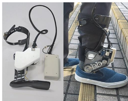
Slika 13. Ankle Robot