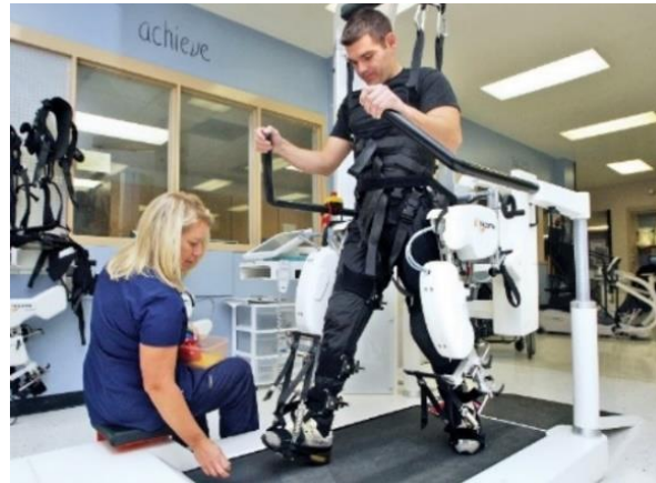
Slika 9. Lokomat

Godine 2001. Švicarski federalni institut za tehnologiju u Zürichu razvio je robota Lokomat ( Slika 9.) za rehabilitaciju hoda tipa egzoskeleta uz korištenje pokretnih traka. Lokomat se sastoji od dvije aktivirane ortoze za noge koje se pričvršćuju na noge pacijenta. Svaka ortoza ima jedan linearni pogon u zglobu kuka i jedan u zglobu koljena za induciranje pokreta fleksije i ekstenzije kuka i koljena u sagitalnoj ravnini. Momenti zglobova koljena i kuka mogu se odrediti pomoću senzora sile između aktuatora i ortoze. Mogu se dodati pasivni podizači stopala kako bi se izazvala dorzalna fleksija gležnja tijekom faze zamaha. Sustav podrške tjelesnoj težini oslobađa pacijente određene količine njihove tjelesne težine putem pojasa (35, 36).