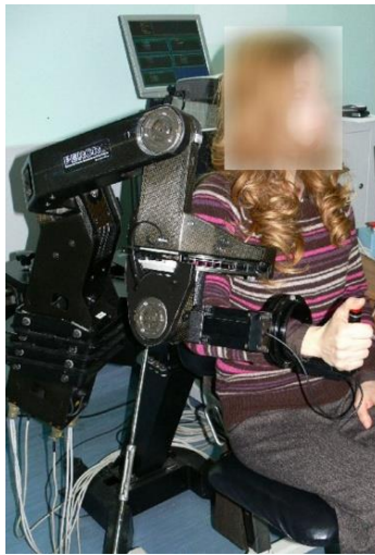
Slika 4. L-Exos

L-Exos (Slika 4.) je aktivni robotski egzoskelet, koji može pružiti ili aktivno vođenje tijekom izvođenja neke vježbe ili gravitacijsku podršku za ruku s utezima. Egzoskelet ima četiri aktivirana stupnja slobode s antropomorfnom kinematikom, tako da se može pružiti aktivna pomoć za abdukciju/adukciju ramena, fleksiju-ekstenziju, unutarnju/vanjsku rotaciju i za ekstenziju/fleksiju lakta, te jedan pasivni pokret, koja odgovara prono-supinacija zgloba (23).