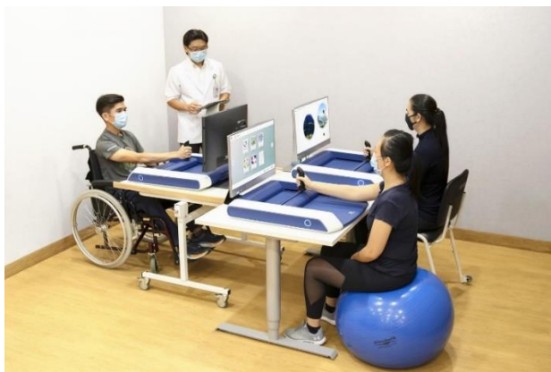
Slika 1. H-Man

H-Man (Slika 1.) je karakteriziran mehaničkim dizajnom temeljenim na kabelskom diferencijalnom prijenosu koji pruža prednosti u odnosu na trenutnu robotsku tehnologiju. Prijenos H-Man znači krajnje pojednostavljenu kinematiku i homogena dinamička svojstva, nudeći mogućnost generiranja haptičkih kanala pasivnim blokiranjem mehanike i eliminirajući probleme vezane uz stabilnost (18). Mehanički dizajn H-Mana pruža mogućnost brzog stvaranja haptičkih kanala pomoću mehaničkih čepova (na jednom od motora). H-Man je uređaj za proučavanje motoričke kontrole i robotsku rehabilitaciju. Hardver je dizajniran s posebnim naglaskom na mehaniku koja rezultira sustavom koji je jednostavan za upravljanje, homogen je i koji je intrinzično siguran za upotrebu (19).