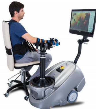
Slika 7. ReoGO

U osnovi modaliteta liječenja je kliničko načelo da pažljivo osmišljen, ponavljajući i vođeni neuromuskularni trening služi poboljšanju učenja i promicanju kortikalne reorganizacije, što zauzvrat pridonosi funkcionalnom oporavku. Kao uređaj potpomognut robotom, ReoGo pruža do deset puta više ponavljanja po treningu od prosječnog nerobotskog tretmana, čime se poboljšava oporavak i rezultati liječenja (21).