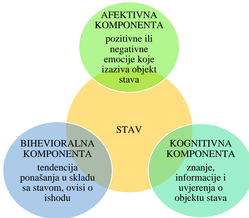
Slika 1 - formiranje stavova prema višekomponentnom modelu, preuzeto sa: https://www.researchgate.net/figure/A-three-component-model-of-the-attitude-formation-A-three-component-model-of-the_fig1_344255118

više kognitivan, a stav prema vođenju bilješki tijekom predavanja ovisi o tome je li vođenje bilješki dovelo do veće ocjene. Također, jačina pojedine komponente koja utječe na formiranje stava se može razlikovati među ljudima, primjerice ljudi glasaju za određene političare jer im se sviđa njihova politika, dok drugi glasaju za određene političare jer im se jednostavno sviđa određena javna osoba neovisno o politici. Iako bi kognitivna komponenta stava trebala biti najsnažnija pri donošenju ove odluke, studije su pokazale da se odluka o glasovanju najčešće temelji na afektivnoj komponenti, koja je generalno najjača komponenta u svim stavovima (14).