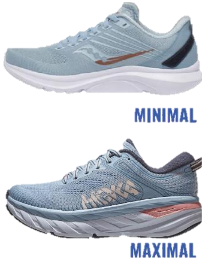
Slika 5: Primjer tenisice s maksimalnim i minimalnim jastučićem

Kod trkača koji imaju supinacijski položaj stopala, preporučaju se tenisice s jastučićem (slika 7) (15).