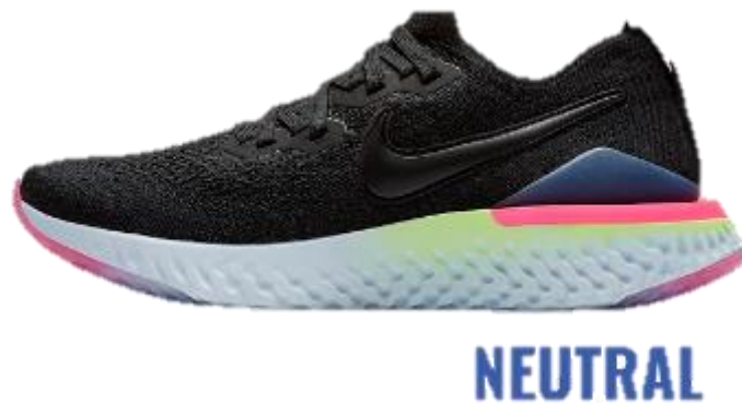
Slika 2: Primjer neutralne tenisice za trčanje

Sportska obuća jedna je od vanjskih čimbenika rizika na koju se u današnje vrijeme sve više stavlja naglasak. Razni brandovi sportske obuće za trčanje naglašavaju njihovu važnost te ih smatraju jedinim alatom koji je potreban da bi se mogli baviti rekreativnim trčanjem. Postoji više vrsta tenisica za trčanje, međutim veliki je problem što ne postoje univerzalni nazivi za svaku vrstu tenisica, već ti nazivi variraju od istraživanja do istraživanja (19). U globalu postoje tri vrste tenisica za trčanje kada bi se gledala morfologija stopala. Za trkače kojima se stopalo nalazi u neutralnom položaju, preporuča se neutralna vrsta tenisica za trčanje (slika 4) (15).