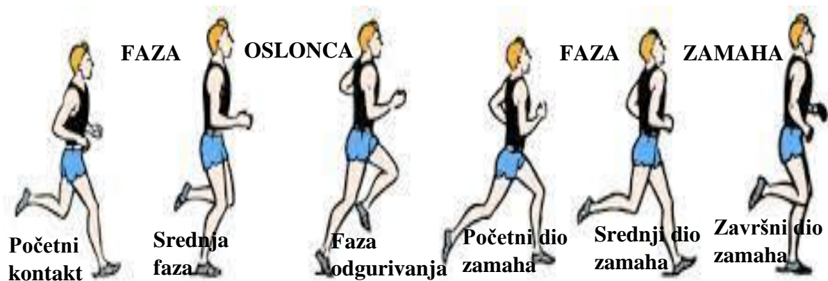
Slika 1: Faze oslonca i zamaha u trčanju