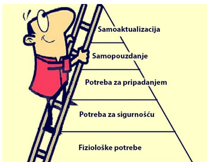
Slika 1 Maslowljeva piramida potreba

Maslowljeva hijerarhija potreba definira da postoje bitne potrebe koje je potrebno prvo zadovoljiti (kao što su fiziološke potrebe i sigurnost), prije nego što se mogu zadovoljiti složenije potrebe (kao što su pripadnost i poštovanje) (16).