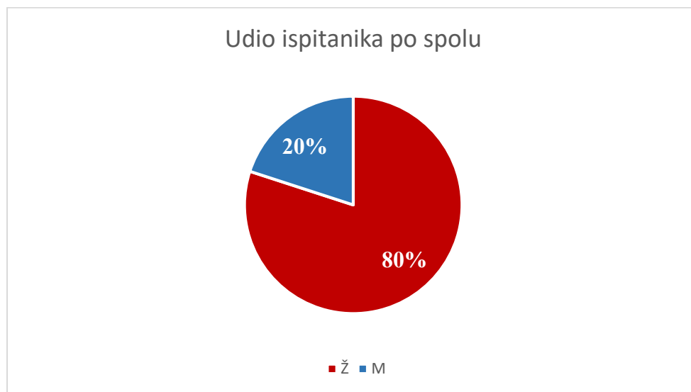
Slika 3 Udio ispitanika prema spolu