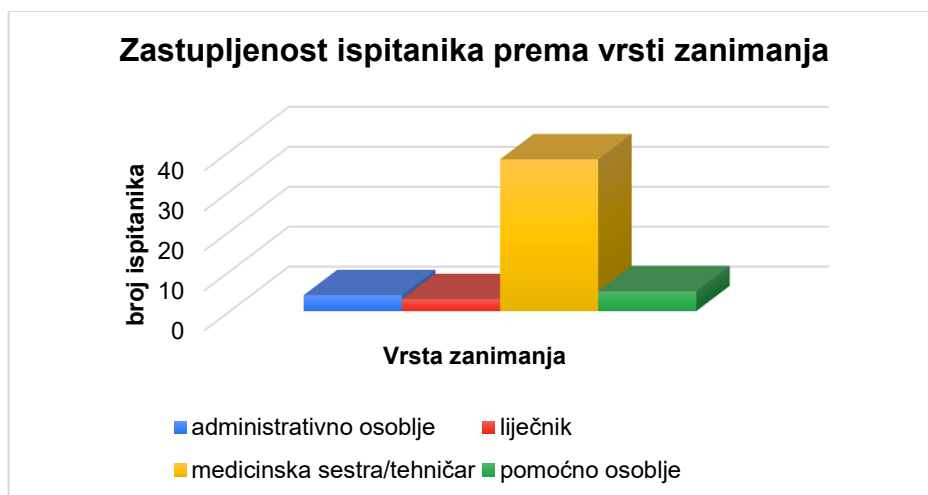
Slika 2 Grafički prikaz ispitanika prema vrsti zanimanja