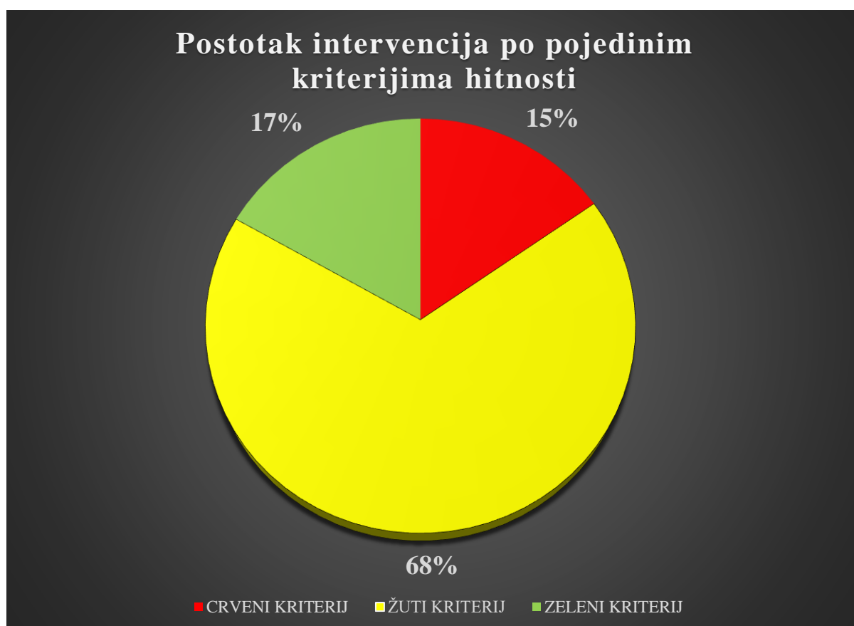
Slika 8 Postotak intervencija po pojedinim kriterijima hitnosti

Iz navedenih podataka proizlazi da se samo 15% poziva na intervenciju odnosi na crveni kriterij, a najveći postotak poziva na intervenciju (68%) označen je žutim kriterijem (slika 8).