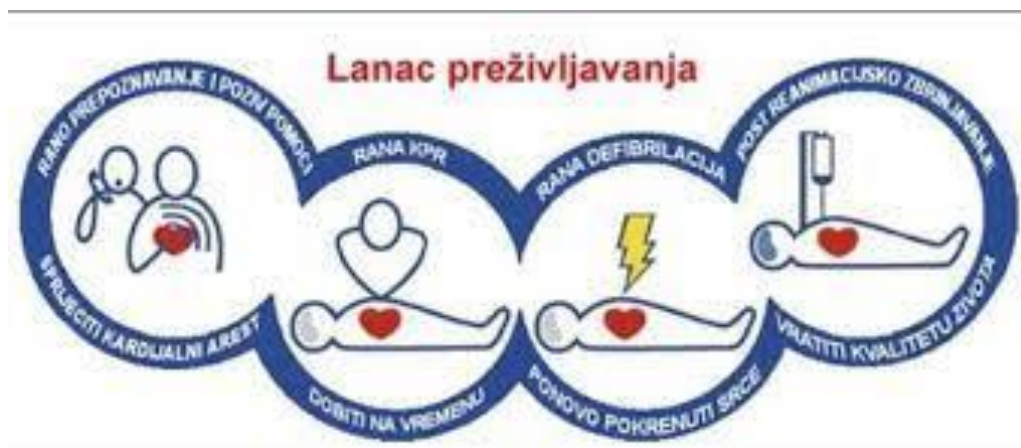
Slika 4 Lanac preživljavanja

Davanje uputa za prvu pomoć izuzetno je bitan dio radnog procesa dispečera. Kao što je poznato, u situacijama srčanog zastoja, čiji je najčešći uzrok ventrikulska fibrilacija (VF), započinjanje kardiopulmonalne reanimacije (KPR) od strane laika i upotreba AVD-a mogu značajno smanjiti smrtnost. AVD-ovi su danas dostupni na većini javnih mjesta, a dispečer ima prikaz njihovih lokacija na monitoru, te je bitno da u slučaju potrebe, uputi pozivatelja ka najbližem AVD-u ili zamoli pozivatelja da pošalje nekoga tko se nalazi u blizini. Također je bitno ohrabriti pozivatelja na provođenje BLS-a dajući mu potrebne upute. Iz svega navedenog, jasno je da MPDJ ima najvažniju ulogu, pored pozivatelja, u lancu preživljavanja (slika 4) (12).