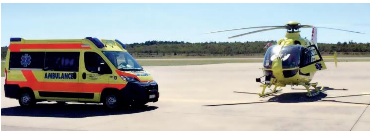
Slika 2 Helikopter Airbus Helicopters i vozilo HMS-a

Kao što je u uvodu spomenuto, ZHM-PGŽ sa sjedištem u Rijeci i 9 ispostava diljem županije, pokriva prostor od 3582 km 2 kopnene površine i skrbi za približno 260.000 stanovnika (11). Pristup pojedinim mjestima otežava raznolikost i nepristupačnost terena, kao i udaljenost, od šuma Gorskog kotara do otočića poput Ilovika. Cijelo to područje pokrivaju ukupno 45 timova T1, 25 timova T2 te 6 timova pripravnosti., a pristup udaljenim otocima omogućava helikopter (slika 2) s medicinskim timom Ministarstva obrane RH (MORH), a baza mu se nalazi u zračnoj luci na otoku Krku.