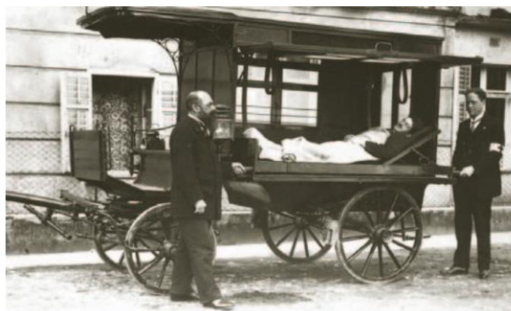
Slika 1 Otvorena kola za prijevoz bolesnika

PGŽ ima poseban značaj u povijesti hitne medicine u Hrvatskoj, jer je upravo u našoj županiji, još 14.siječnja 1894.g u Opatiji, osnovana prva hitna medicinska služba (HMS) u RH. Događaj koji je prethodio osnivanju HMS-a u Opatiji, tragedija je koja se dogodila nekoliko godina ranije u Beču, gdje je zbog loše organizacije spasilačkih službi, broj žrtava bio izuzetno velik. Ono što se pokazalo dobro organiziranom službom bila je bečka vatrogasna postrojba, po čijem je uzoru nakon nemilog događaja osnovana i prva spasilačka zdravstvena služba u svijetu u Beču. S obzirom da je njezin osnivač, barun dr. Jaromir von Mundy, ujedno i zaljubljenik u Opatiju, po uzoru na Beč, organizirao je istu takvu službu i u Opatiji. Za prvog ravnatelja hitne medicinske službe u Opatiji imenovan je dr. Franz Tripold, koji je već tada bio liječnik u Dobrovoljnom vatrogasnom društvu Opatija, zbog čega su ove dvije službe djelovale kao jedna. Možemo slobodno reći, kako je za ono vrijeme, opatijska HMS bila poprilično dobro opremljena. Raspolagala je sa 4 benzinska vozila, od čega je jedno imalo nosila i 2 sjedeća mjesta (slika 1), te najmoderniju opremu onog doba. HMS Opatija također je imala ambulantu, operacijsku salu, prostor za sterilizaciju, bolesničke sobe s posebnim djelom za duševne bolesnike, te kompletno uređeni sanitarni čvor (10). Možemo slobodno reći, više nego neke ispostave u modernom dobu.