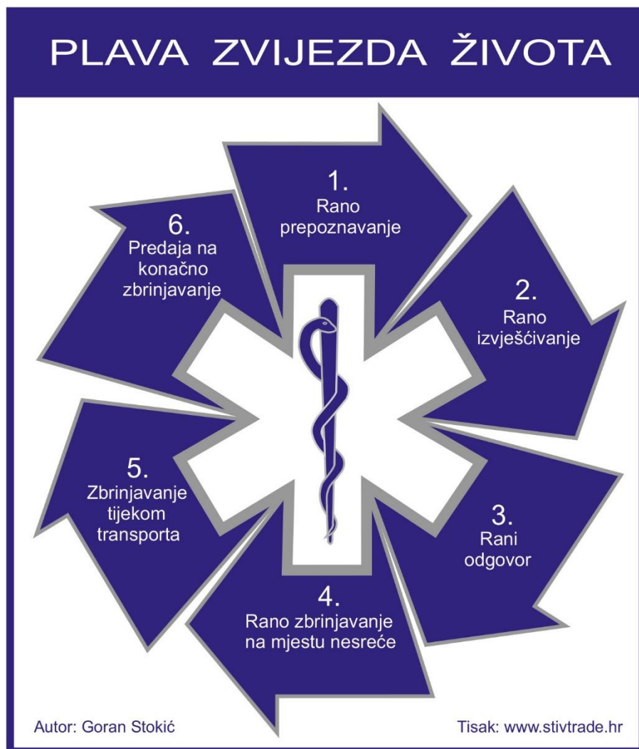
Slika 3 Zvijezda života

Međunarodni simbol izvanbolničkih hitnih medicinskih službi, zvijezda života (slika 3), vizualno predstavlja svu srž MDS-a. Glavna je zadaća MDS-a u što kraćem roku odazvati se na hitni medicinski poziv, skupiti sve potrebne informacije, razvrstati ih i donijeti pravu odluku koji tim poslati na intervenciju. Drugim riječima, dispečer/disponent, prima i razvrstava poziv, određuje stupanj hitnosti na osnovu kojeg određuje izlazak odgovarajućeg tima, te upravlja timovima na terenu (12).