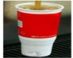
Limenka/boca oko 1 L (32 oz)

Konzumirate li energetska pića najmanje jednom tjedno?