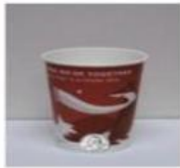
Mala kava, oko 350 ml (12 oz)