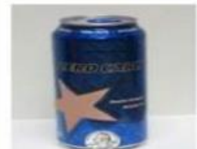
Limenka/boca oko 500 ml (18 oz)

Konzumirate li čaj najmanje jednom tjedno?