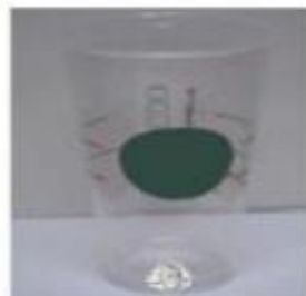
Velika ledena kava, oko 600 ml (20 oz)