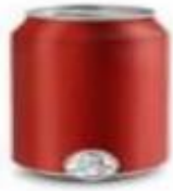
Limenka/boca oko 330 ml (12 oz)

Molim Vas označite koliko porcija gaziranog pića u prosjeku konzumirate tjedno. Neka gazirana pića ne sadrže kofein. Primjer: Sprite, 7-Up, gazirani sokovi od naranče, itd