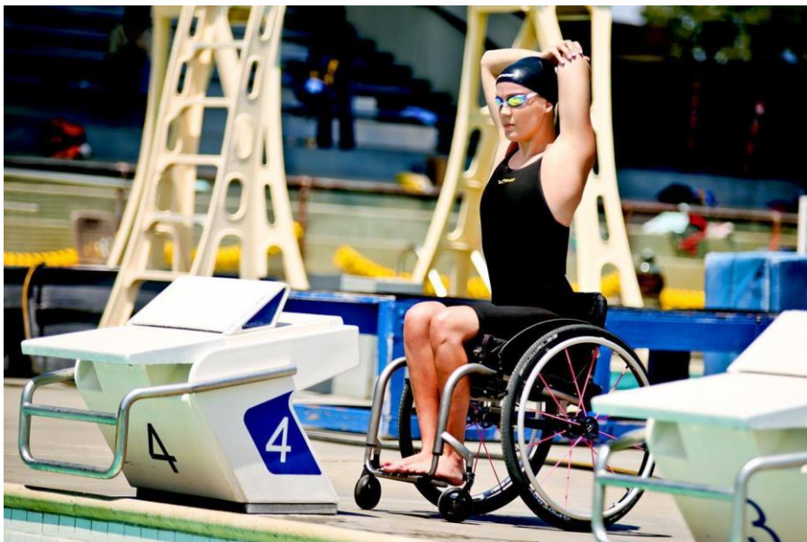
Slika 7. Paraplivanje.

Sportaši koji imaju različita oštećenja mogu se međusobno natjecati u paraplivanju zbog toga što se sportske klase dodjeljuju na temelju utjecaja oštećenja na plivanje, a ne prema samom oštećenju. Postoje različiti stilovi plivanja pa tako imamo : slobodni stil, prsno plivanje, leđno plivanje i leptir plivanje (47).