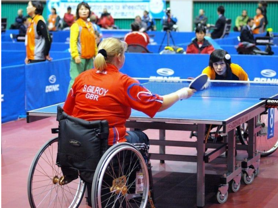
Slika 3. Para stolni tenis.

Igranje stolnog tenisa poboljšava izdržljivost i snagu, ravnotežu i koordinaciju igrača. Također ima antidepresivni učinak i pomaže u integraciji osoba sa invaliditetom a stalne inovacije u ovom sportu osiguravaju da osobe s invaliditetom mogu još više sportski napredovati te promicati duh inkluzivnosti.