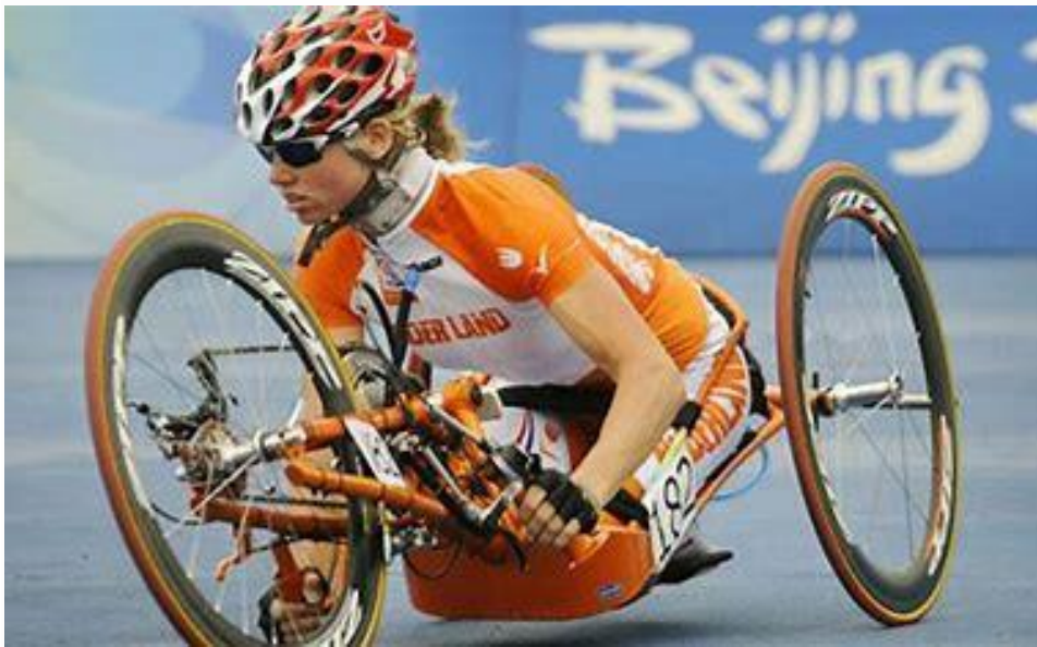
Slika 4. Biciklizam na ručni pogon. Preuzeto s: https://deadspin.com/5864784/silver-medal-winning-paralympic-cyclist-may-compete-in-actual-olympics (22.05.2024)

sustav klasifikacije temeljen je na funkcijama sportaša te dopušta mješovita oštećenja unutar kategorije što znači da je moguće da se sportaš s lokomotornim oštećenjem natječe protiv sportaša koji ima poremećaj koordinacije. Svaka kategorija ima vlastiti skup pravila i prilagodbi opreme kako bi se prilagodila invaliditetu sportaša (55).