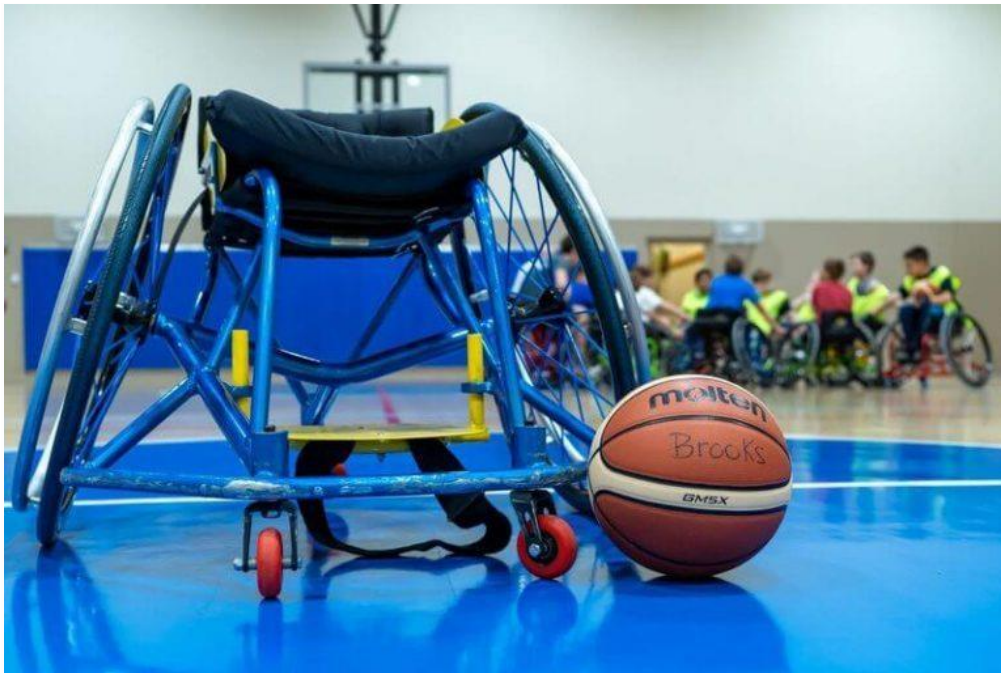
Slika 2. Košarkaška sportska kolica.

Pravila i norme košarke u kolicima donosi Međunarodna federacija košarke u kolicima (International Wheelchair Basketball Federation, IWBF) koja je osnovana 1973. godine (45) a koja je nadležna i Hrvatskom savezu košarke u kolicima. Ključna razlika između košarke u kolicima i tradicionalne košarke je sustav klasifikacije. Košarkaši u kolicima klasificiraju se pomoću bodovnog sustava od 1 do 4,5 boda ( 1.0, 1.5, 2.0, 2.5, 3.0, 3.5, 4.0 i 4.5) prema razini oštećenja i funkcionalnoj sposobnosti, a maksimalan zbroj bodova u ekipi ne smije premašiti 14 bodova. Kod donošenja klasifikacije sportaša uzima se u obzir raspon pokreta, snaga i koordinacija kako bi se ispitao utjecaj oštećenja na određene situacije u igri. Manji broj bodova igrača ukazuje na smanjenu funkcionalnu sposobnost. Košarka u kolicima je prvi prilagođeni sport koji je krenuo koristiti ovu složenu klasifikaciju od osam klasa prema funkcionalnoj sposobnosti igrača, a ne prema medicinskoj kategorizaciji, odnosno njihovom invaliditetu kako se to uobičavalo. Ostali adaptivni sportovi su nastavili slijediti taj primjer klasifikacije s namjerom da se stvore jednaki uvjeti za sve sudionike u sportu (49).