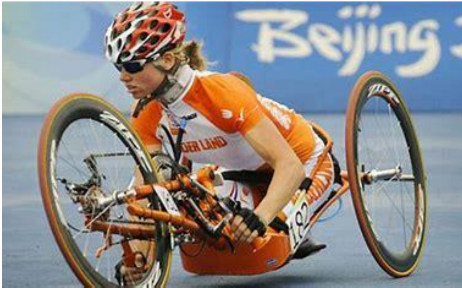
Slika 4. Biciklizam na ručni pogon.

sustav klasifikacije temeljen je na funkcijama sportaša te dopušta mješovita oštećenja unutar kategorije što znači da je moguće da se sportaš s lokomotornim oštećenjem natječe protiv sportaša koji ima poremećaj koordinacije. Svaka kategorija ima vlastiti skup pravila i prilagodbi opreme kako bi se prilagodila invaliditetu sportaša (55).