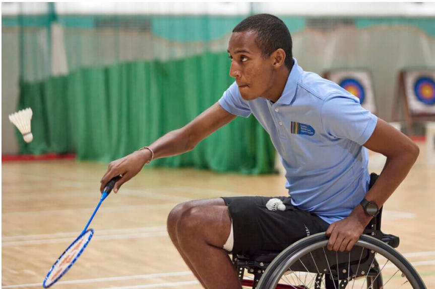
Slika 6. Parabadminton.

Parabadminton je podijeljen u šest kategorija prema stupnju tjelesnog invaliditeta sportaša te se svaki igrač badmintona mora klasificirati prije međunarodnog natjecanja. Može se igrati u invalidskim kolicima i kao takav namijenjen je sportašima s invaliditetom donjih ekstremiteta odnosno za sportaše koji za kretanje koriste invalidska kolica. Tijekom njihove igre visina mreže i dimenzije terena za badminton prilagođeni su za igru u invalidskim kolicima. Stojeći badminton mogu igrati i sportaši s invaliditetom gornjih ekstremiteta. Sportaši sa takvim oštećenjem tijekom igre koriste prilagođene rekete (57).