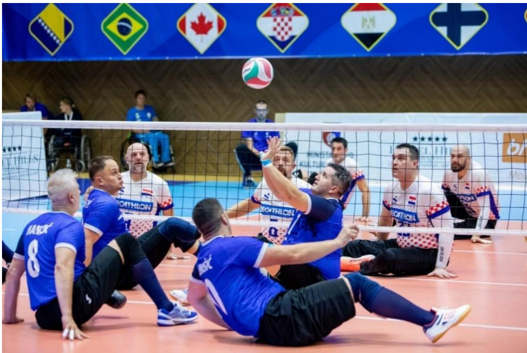
Slika 5. Sjedeća odbojka.

Mreža u sjedećoj odbojci je spuštена na visinu jednog metra, a veličina terena je 60 m 2 . Igračima sjedeće odbojke dozvoljeno je blokirati servise, uz uvjet da je glutealni dio igrača u kontaktu sa podlogom cijelo vrijeme (47).