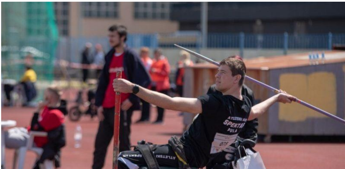
Slika 1. Paraaletika. Preuzeto s https://du-sportivo.hr/wp-content/uploads/2023/04/

Međunarodno upravljanje paraatletikom za osobe sa tjelesnim invaliditetom nadzire Svjetski paraatletski pododbor, paraatletiku za osobe sa intelektualnim poteškoćama Međunarodna sportska federacija za osobe sa s intelektualnim invaliditetom, a atletikom gluhih osoba upravlja Međunarodni odbor za sport gluhih (31).