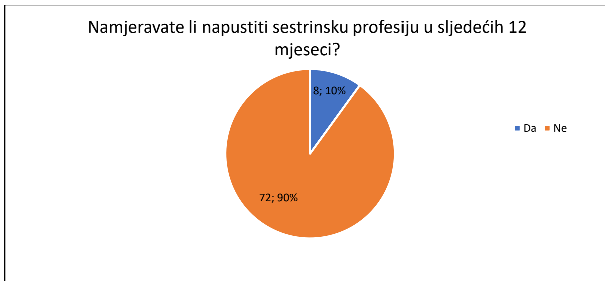
Slika 1 Namjera o napuštanju sestrinske profesije u sljedećih 12 mjeseci

Za razliku od prethodnog, 10 (12%) ispitanika namjerava napustiti sestrištvo nekada u budućnosti, a njih 70 (88%) uopće ne namjerava u budućnosti napustiti sestrištvo (Slika 2.).