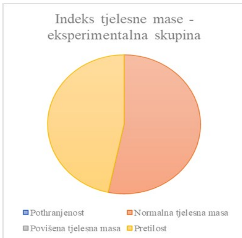
Slika 2. Dijagram ITM-a – eksperimentalna skupina