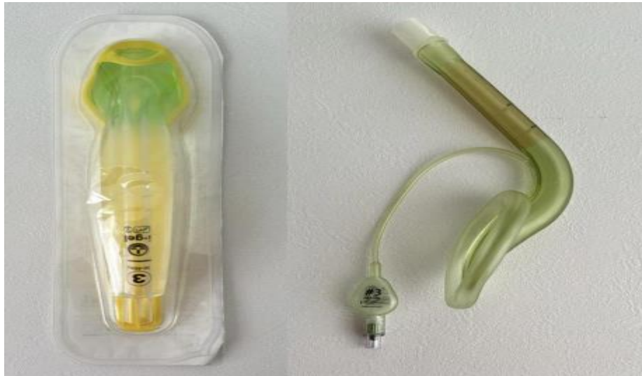
Slika 4. I-gel maska i laringealne maske

Laringealne maske (Slika 4) su još poznate i kao i-gel maske, a postavljaju se preko usta pacijenta te se sastoje od mekog dijela te tvrdog dijela, dok se meki dio postavlja na mjesto iznad grkljana (5).