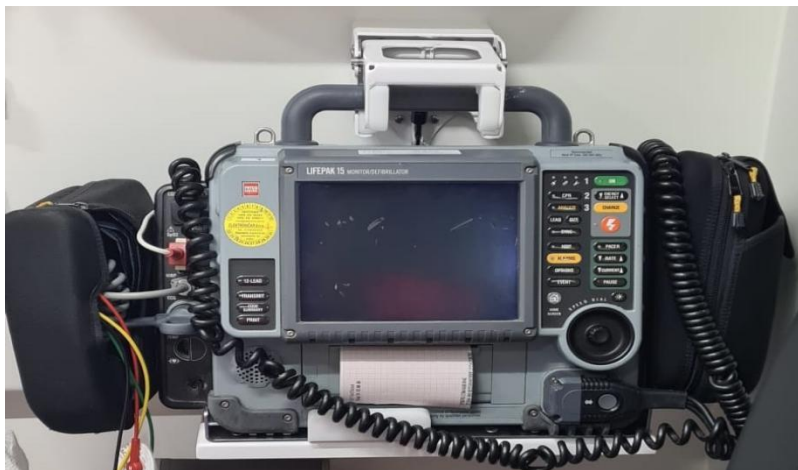
Slika 6. Defibrilator koji se koristi u izvanbolničkim uvjetima KPR

Defibrilacija je postupak primjene istosmjerne električne struje pomoću defibrilatora kroz srce pacijenta kako bi se prekinule životno ugrožavajuće aritmije. Primjenjuje se kod VF-a i VT-a bez pulsa, a kako je ventrikularna fibrilacija jedan od najčešćih uzroka srčanog zastoja, defibrilator je postao neizostavan dio medicinske opreme tima izvanbolničke hitne medicinske pomoći (slika 6).