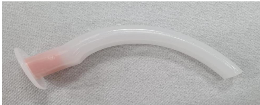
Slika 3. Orofaringealni tubus

Orofaringealni tubus (Slika 3) se postavlja kroz usta te pridržava jezik, odnosno prevenira padanje jezika unazad (5). Izrađen je od tvrde plastike.