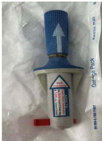
Slika 7. Intraosealna igla za odrasle

Tijekom izvođenja naprednih mjera KPR-a važnu ulogu ima primjena lijekova. Otvaranje venskog puta kod pacijenata prilikom izvođenja KPR-a može predstavljati izazove, osobito ako pacijent nema srčane akcije te krv ne cirkulira kroz tijelo. Ako medicinske sestre/medicinski tehničari ne uspiju postaviti venski put putem intravenske kanile, za davanje lijekova se otvara put preko kosti pri čemu se intraosealnim iglama (Slika 7) postavlja na jedno od za to predviđenih mjesta (proksimalni dio humerusa, proksimalni dio tibije, distalni dio tibije).