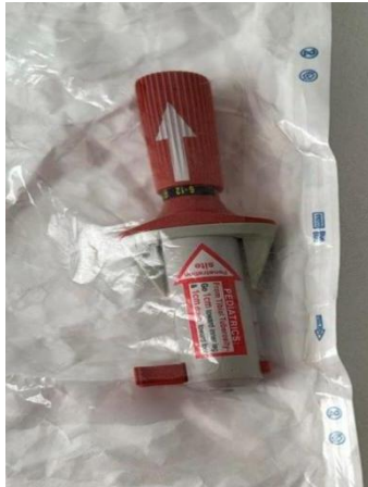
Slika 8. Intraosealna igla za djecu

Nakon defibrilacije nastavlja se KPR tijekom sljedeće dvije minute, pa se provjerava srčani ritam. Adrenalin se aplicira u dozi od 0,01 mg/kg, odnosno 0,1 ml/ kg u razrjeđenju od 1: 10 000, svakih 3 do 5 minuta (12). U slučaju VTbp i VF treba razmotriti davanje amiodarona koji se daje u dozi od 5 mg/kg razrijeđen u 20 ml 5% glukoze (13). Otvaranje venskog pristupa kod djece može biti otežano, pa se koristi i intraosealna igla za otvaranje intraosealnog puta, ukoliko se u periodu od jedne minute ne uspije osigurati periferni venski put (Slika 8).