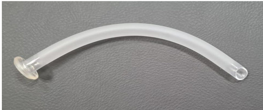
Slika 2. Nazofaringealni tubus

Nazofaringealni tubus (Slika 2) postavlja se kroz nos pacijenta te ako dođe do pada jezika unazad, ovaj tubus održava dišni put otvorenim. Izrađen je od silikona ili meke, savitljive plastike.