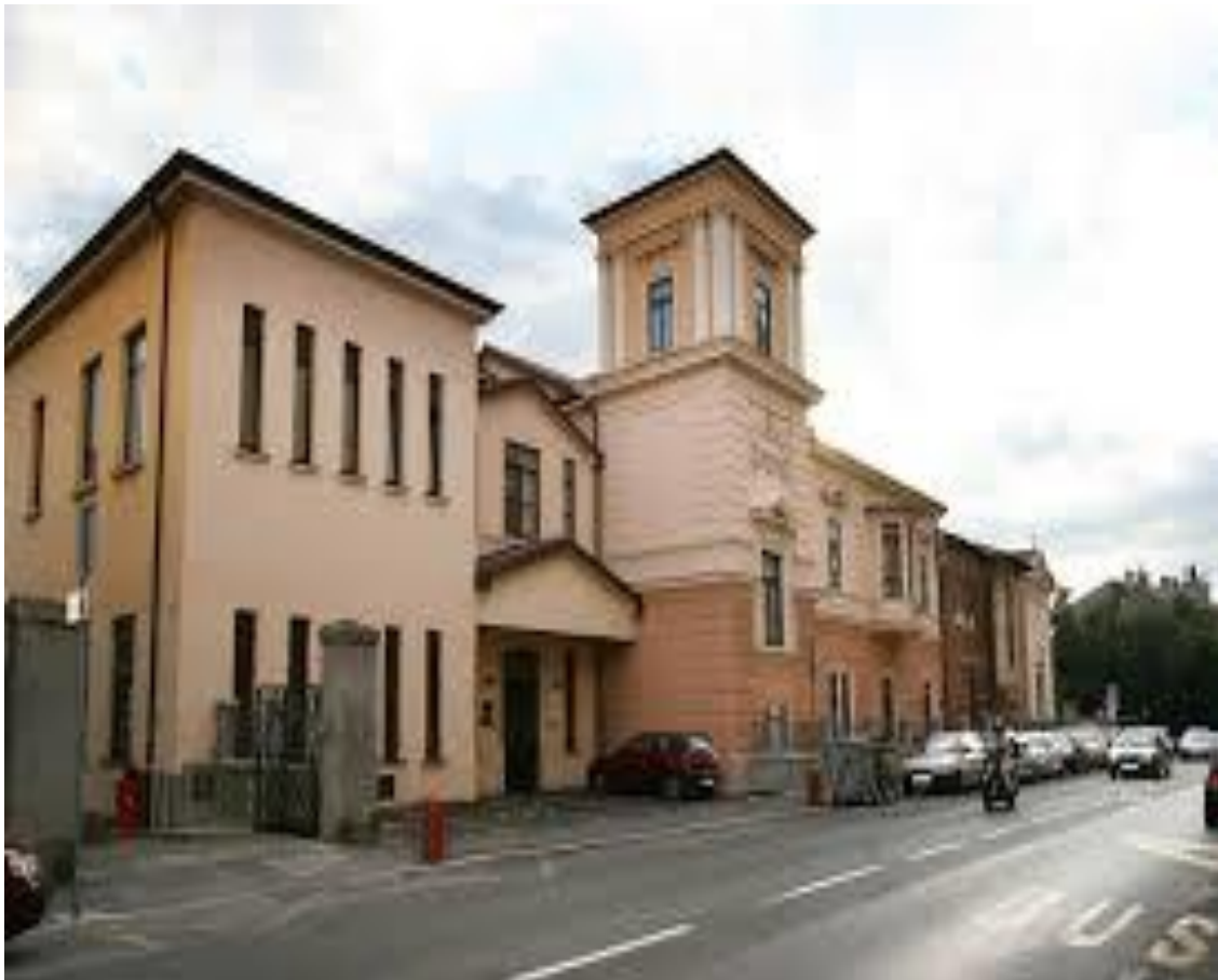
Slika 1 Hospicij u Rijeci