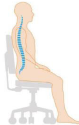
Slika1. Pravilan položaj prilikom izvođenja autogene drenaže.

U prvoj fazi autogene drenaže pacijent izvodi udisaje manjeg volumena za prolaz sekreta iz perifernih dišnih puteva. Druga faza se bazira na udisajima srednjeg volumena kako bi se skupio sekret u središnjim dišnim putevima. U završnoj fazi udisaji velikog plućnog volumena omogućavaju izbacivanje sluzi iz centralnih dišnih puteva (20). Prije početka drenaže ako su pacijentu začepjeni gornji dišni putevi potrebno ih je očistiti ispuhavanjem nosa, sprejem za nos ili pomoću ispiranja sinusa. Pravilan je dobro poduprti položaj s izravnatom kralježnicom i opuštenim mišićima vrata i ramena (20).