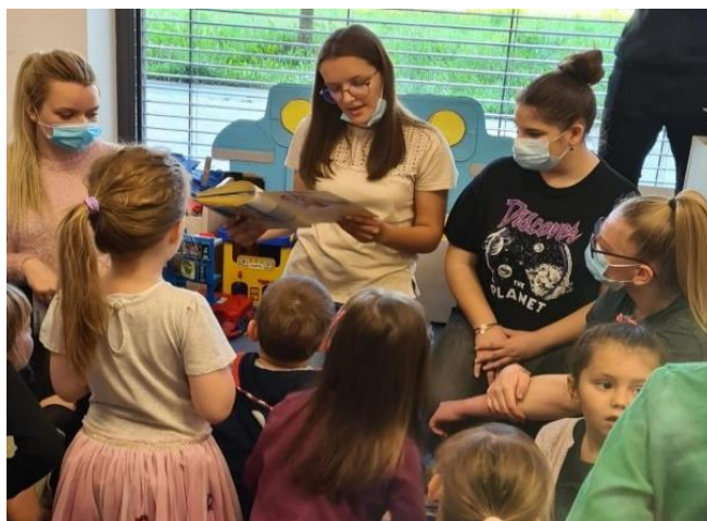
Slika 7. Projekt: „Sestre čitalice“

Projekt škole „Sestre čitalice“ (Slika 7) je humanitarnog i odgojnog značaja u koji su uključeni učenici volonteri trećih razreda. Cilj je promicanje i poticanje čitanja kod djece mlađe dobi.