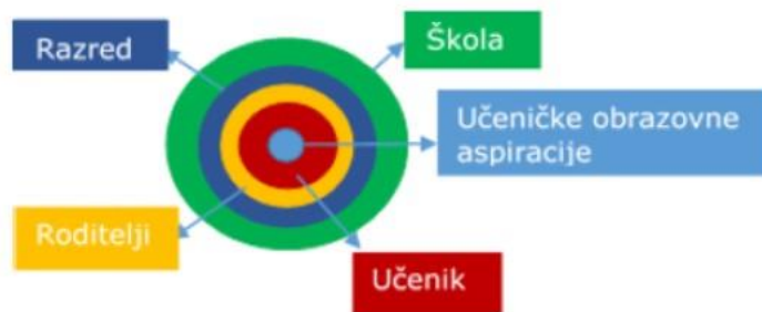
Slika3. Ekološki model učeničkih obrazovnih aspiracija

Cilj nastave danas je učenje koje se temelji na razvoju učenika kroz njegovo trajno unapređenje i davanje poticaja za njegova osobna postignuća (31).