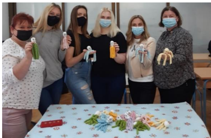
Slika 6. Projekt: „Hobice za bebe“