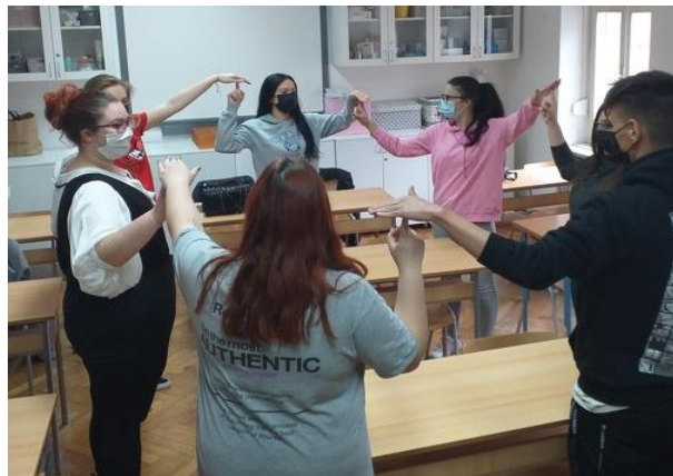
Slika 9. Projekt škole: „Ujedinjeni u različitosti“

U sklopu Europskih snaga solidarnosti u Školi se provodi projekt u kojem sudjeluju učenici četvrtih i petih razreda „Ujedinjeni u različitosti“ zajedno s partnerom projekta, organizacijom Platypus. Tijekom projekta učenici su organizirali sastanke, radionice i predavanja s trans i interseksualnim osobama, ali i liječnicima koji sudjeluju u zdravstvenoj skrbi za trans i interseksualne osobe (Slika 9).