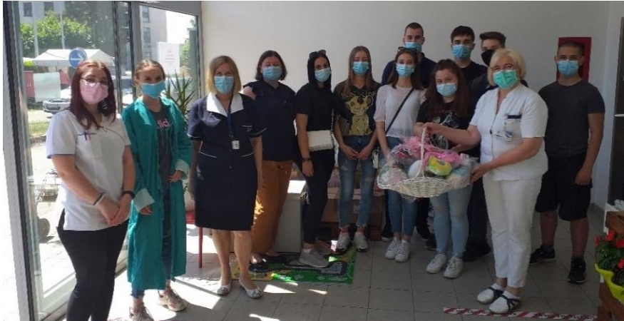
Slika 8. Projekt: „Igračkom do dječjeg osmjeha“