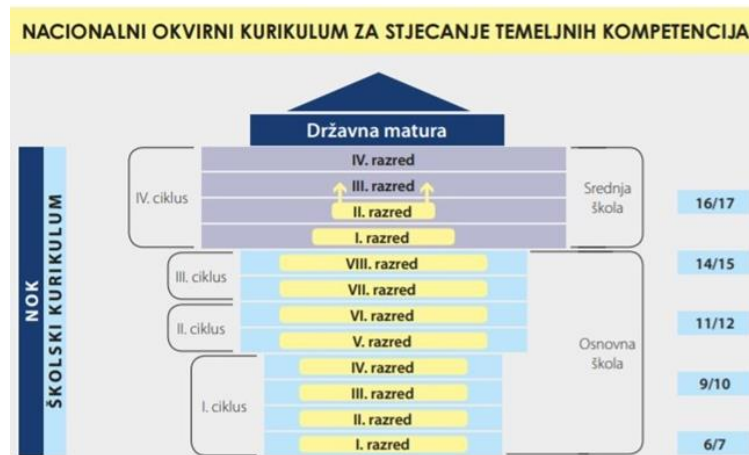
Slika1. Odgojno-obrazovni ciklusi za stjecanje temeljnih kompetencija

Na snagu je stupio 2011. godine „Nacionalni okvirni kurikulum (NOK) za područje predškolskog odgoja i obrazovanja te opće obvezno i srednjoškolsko obrazovanja“. Njegova osnovna kvaliteta ogleda se u tome što je osigurao da se svi sastavni dijelovi sustava povežu u jednu skladnu cjelinu (8). Osnovna karakteristika ovog kurikuluma je prijelaz težišta s nastavnih sadržaja na postignuća učenika (ishode učenja). Ishodi učenja jasno i konkretno definiraju što se želi postići nastavom odnosno opisuju što učenik mora naučiti (znanje, vještine, stavovi). Nakon uspješnog savladavanja programa predmeta, učenik će znati obavljati određene aktivnosti na društveno prihvatljivoj razini (8). Pod kompetencijama podrazumijevamo mogućnost osobe da stečene vještine i znanja iskoristi u praksi te time poboljša svoj osobni i profesionalni razvoj. Jedan takav primjer jesu kompetencije odgovornosti i samostalnosti koje se smatraju osnovnim odgojnim kompetencijama (9).