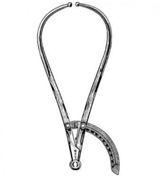
Slika 2. Prikaz pelvimetra po Martinu

Osim unutarnjih mjera zdjelice od velike su važnosti i vanjske mjere zdjelice koje nam mogu pomoći u prepoznavanju zdjelice uskog ili nepravilnog oblika. Mjerne točke su lat. distantia spinarum kojom se gleda udaljenost između lat. spina iliaca anterior superior i ona iznosi 25-26 cm, zatim lat. distantia cristarum , odnosno udaljenost između lat. crista iliaca koja iznosi 28-29 cm, lat. distantia trochanterica ili udaljenost između lat. trochantera femura koja iznosi 32-33 cm te lat. conjugata externa kojom se gleda udaljenost od gornjeg ruba simfize do 5.lumbalnog kralješka i ona iznosi 20 cm. Za mjerenje vanjskih mjera zdjelice koristi se šestar po Martinu, odnosno pelvimetar (slika 2).