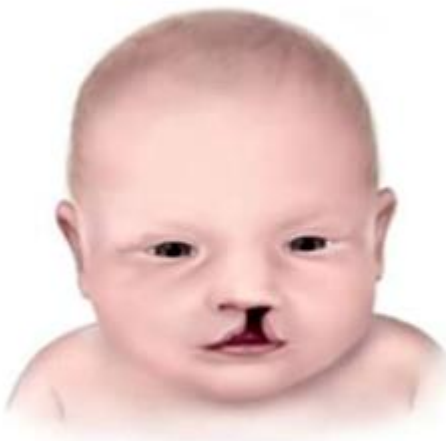
Slika 1. Prikaz djeteta s rascjepom usne i nepca