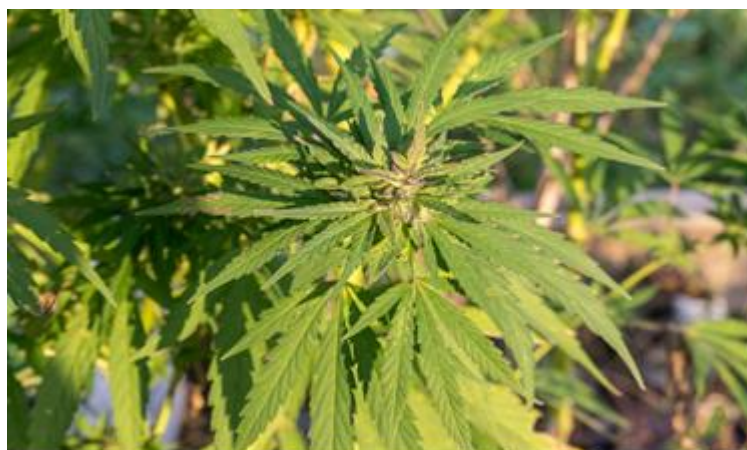
Slika 2. Prikaz Kanabis sative

Marihuana se koristi već tisućama godina u medicinske i rekreacijske svrhe. To je prirodna tvar koja se dobiva iz biljke kanabis sativa (Slika 2) (10) poseban pripravak koji nastaje od sušenog lišća, grančica, sjemena i cvijeta poznatih kao kanabinoidi (11).