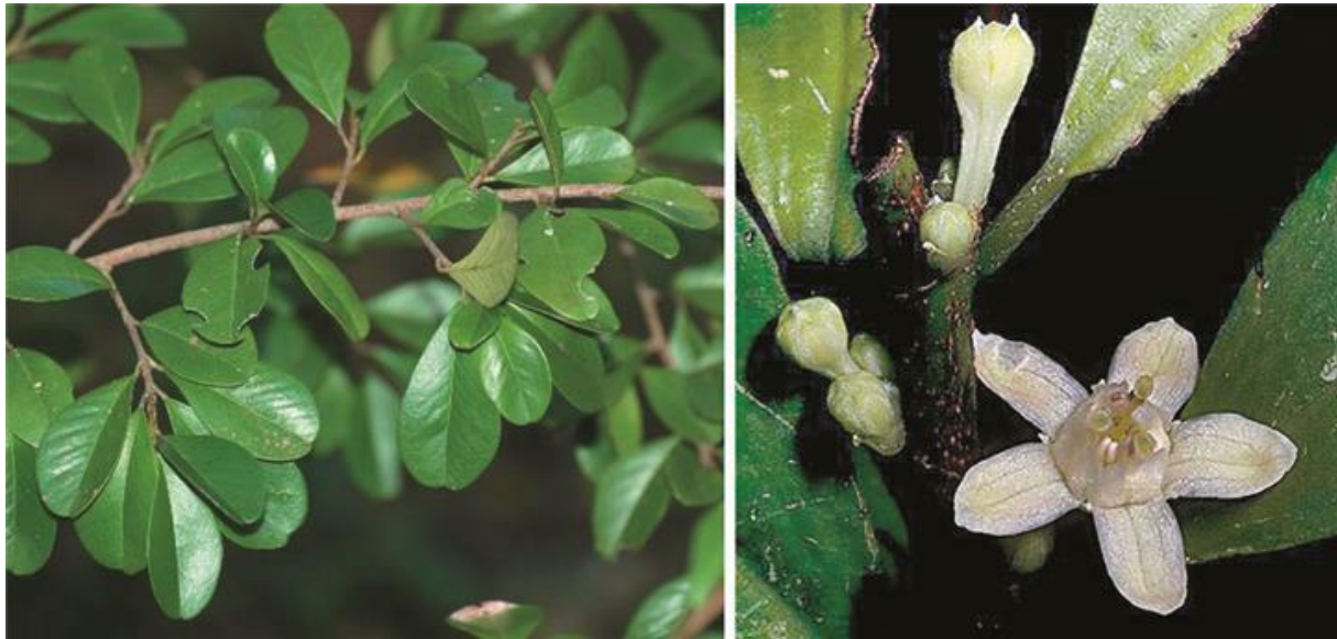
Slika 3. Prikaz Erythroxylon coca

koji se dobiva sintetskim putem. Može biti transnazalan put upotrebe, peroralan, parenteralan ili pušenjem.