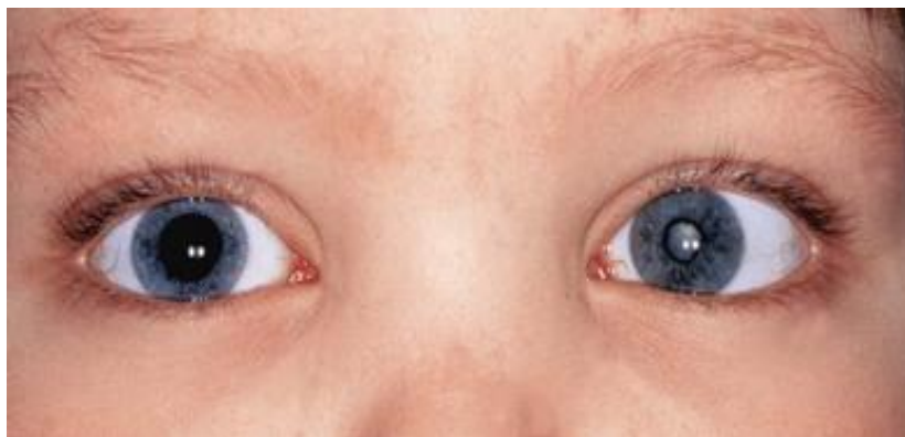
Slika 4 - uveitis

Kronični, prednji, negranulomatozni uveitis razvija se kod 20% pacijenata s oligoartikularnim tipom i 10% pacijenata s poliarтикуlarnim tipom, a jedini poznati čimbenik rizika je pozitivan ANA test (47,48). Početak kroničnog uveitisa obično je podmukao i često potpuno asimptomatičan, iako do polovice zahvaćene djece ima simptome koji se mogu pripisati uveitisu poput boli, crvenila, glavobolje, fotofobije i promjene vida. Uveitis može biti prisutan u vrijeme postavljanja dijagnoze, može se razviti tijekom napredovanja bolesti ili može biti početna manifestacija. Najraniji znakovi uveitisa pri pregledu s prorezom svjetiljke su prisutnost upalnih stanica i povećana koncentracija proteina u vodenoj masi prednje očne komore, a kasnije u tijeku bolesti može se razviti taloženje upalnih stanica na unutarnjoj površini rožnice (47,48).