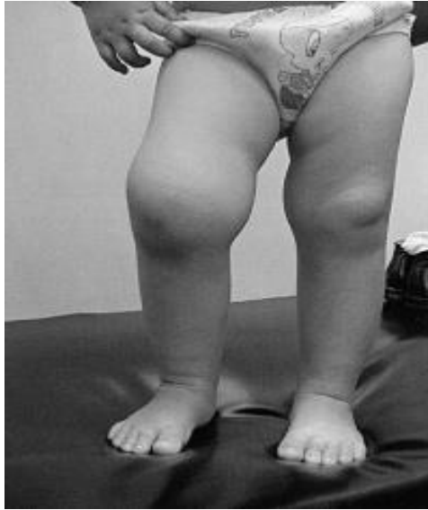
Slika 2 - artritis desnog koljena

Sistemska JIA može prethoditi artritisu tjednima i mjesecima ili rijetko godinama, odnosno najčešće se primarno razvija groznica i karakterističan osip, a kasnije artritis zahvaća velike i male zglobove. Najistaknutija značajka sistemske JIA je povišena tjelesna temperatura koja obično raste do 39 °C ili više, nekoliko puta dnevno nakon čega slijedi povratak na normalnu temperaturu. Povišenu tjelesnu temperaturu gotovo uvijek prati specifičan osip, koji je prolazan te obično dolazi i odlazi s skokovima tjelesne temperature i sastoji se od diskretnih, ograničenih, ružičastocrvenih mrlja koje mogu biti okružene blijedim prstenom. Osip je najčešće na trupu i proksimalnim ekstremitetima, uključujući pazušne i ingvinalne dijelove, ali se može razviti i na licu, dlanovima ili tabanima, a ima tendenciju migriranja (45,46).