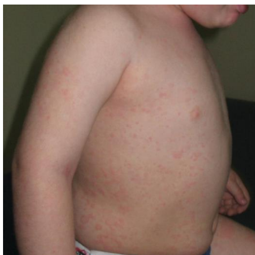
Slika 3 - osip karakterističan za sistemska JIA, preuzeto sa https://link.springer.com/chapter/10.1007/978-3-319-96929-9_13

Sistemska JIA može prethoditi artritisu tjednima i mjesecima ili rijetko godinama, odnosno najčešće se primarno razvija groznica i karakterističan osip, a kasnije artritis zahvaća velike i male zglobove. Najistaknutija značajka sistemske JIA je povišena tjelesna temperatura koja obično raste do 39 °C ili više, nekoliko puta dnevno nakon čega slijedi povratak na normalnu temperaturu. Povišenu tjelesnu temperaturu gotovo uvijek prati specifičan osip, koji je prolazan te obično dolazi i odlazi s skokovima tjelesne temperature i sastoji se od diskretnih, ograničenih, ružičastocrvenih mrlja koje mogu biti okružene blijedim prstenom. Osip je najčešće na trupu i proksimalnim ekstremitetima, uključujući pazušne i ingvinalne dijelove, ali se može razviti i na licu, dlanovima ili tabanima, a ima tendenciju migriranja (45,46).