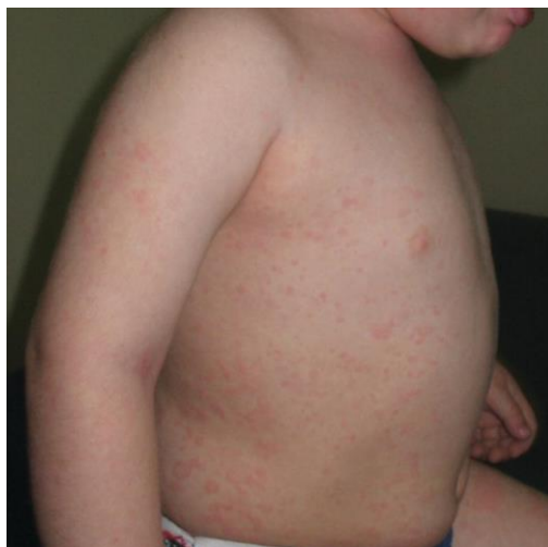
Slika 3 - osip karakterističan za sistemska JIA, preuzeto sa https://link.springer.com/chapter/10.1007/978-3-319-96929-9_13

Sistemska JIA može prethoditi artritisu tjednima i mjesecima ili rijetko godinama, odnosno najčešće se primarno razvija groznica i karakterističan osip, a kasnije artritis zahvaća velike i male zglobove. Najistaknutija značajka sistemske JIA je povišena tjelesna temperatura koja obično raste do 39 °C ili više, nekoliko puta dnevno nakon čega slijedi povratak na normalnu temperaturu. Povišenu tjelesnu temperaturu gotovo uvijek prati specifičan osip, koji je prolazan te obično dolazi i odlazi s skokovima tjelesne temperature i sastoji se od diskretnih, ograničenih, ružičastocrvenih mrlja koje mogu biti okružene blijedim prstenom. Osip je najčešće na trupu i proksimalnim ekstremitetima, uključujući pazušne i ingvinalne dijelove, ali se može razviti i na licu, dlanovima ili tabanima, a ima tendenciju migriranja (45,46).