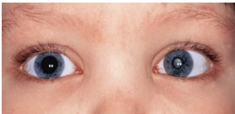
Slika 4 - uveitis

Kronični, prednji, negranulomatozni uveitis razvija se kod 20% pacijenata s oligoartikularnim tipom i 10% pacijenata s poliartrikularnim tipom, a jedini poznati čimbenik rizika je pozitivan ANA test (47,48). Početak kroničnog uveitisa obično je podmukao i često potpuno asimptomatičan, iako do polovice zahvaćene djece ima simptome koji se mogu pripisati uveitisu poput boli, crvenila, glavobolje, fotofobije i promjene vida. Uveitis može biti prisutan u vrijeme postavljanja dijagnoze, može se razviti tijekom napredovanja bolesti ili može biti početna manifestacija. Najraniji znakovi uveitisa pri pregledu s prorezom svjetiljke su prisutnost upalnih stanica i povećana koncentracija proteina u vodenoj masi prednje očne komore, a kasnije u tijeku bolesti može se razviti taloženje upalnih stanica na unutarnjoj površini rožnice (47,48).