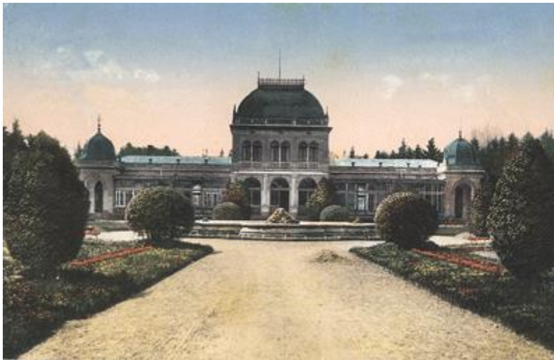
Slika 2. Kursalon početkom 20. stoljeća

Iste godine, 1885. Knoll prodaje lječilište dvojici liječnika iz Pešte, a prof. Bella Legyel na sveučilištu Budimpešti potvrđuje prvotne analize - Lipik su jedine vruće jodne toplice u Europi. Novi vlasnici u periodu od 1886. do 1893. grade brojne nove objekte. Izgrađene su Rimske, Mramorne i Salonske kupke, lijepe zgrade s kadama od porculana i mramornim pločicama. 1892. izgrađen je Kursalon - lječilišni salon, prostrano, dijelom ostakljeno zdanje, natkriveno monumentalnom kupolom (2).