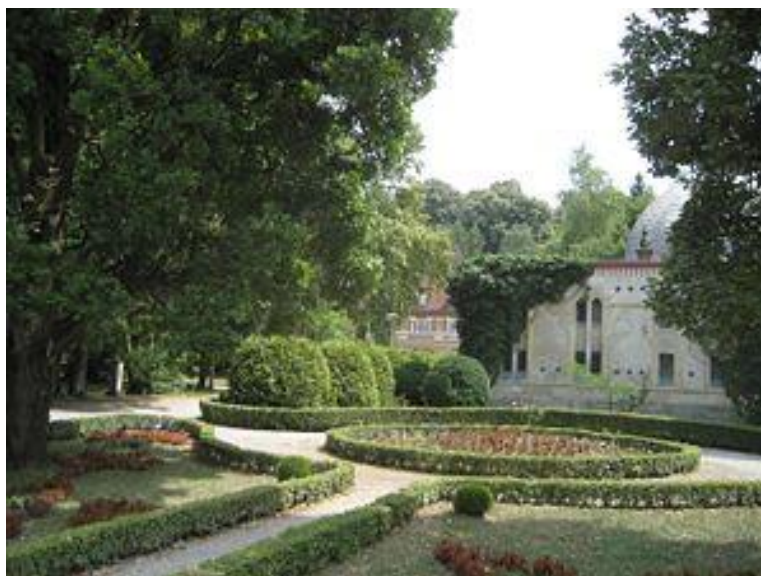
Slika 1. Pogled na Julijev park i Anine blatne kupke