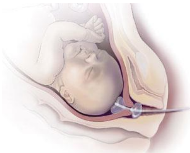
Slika 5. cervikalni balon (engl. Cervical ripening balloon)

Budući da mehanički agensi predstavljaju strana tijela stavljena u vrat maternice, mnogi opstetričari smatraju da bi njihova upotreba mogla povećati rizik od infekcije. Što i pokazuju razna istraživanja koja su pokazala kako su infekcije majki i novorođenčadi povećana kod indukcija poroda raznim mehaničkim metodama. (3)