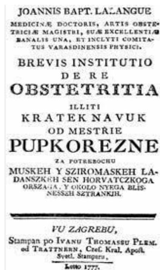
Slika 1. Naslovnica Lalanguove knjige „Brevisinstitutio de reobstetricia“ illiti „Krateknavuk od mestriepupkorezne“ Zagreb, Trattner 1777.

Primaljstvo je jedna od najstarijih medicinskih struka. U prošlosti su tijekom poroda skrb pružale priučene žene, koje su znanje stjecale iskustvom. Kasnije se pokazala nužna potreba za školovanjem primalja kako bi se pružila kvalitetnija skrb za roditelje i novorođenčad. (7) Prateći povijesni razvoj medicine i društva može se jasno vidjeti kako su zakonodavstvo, broj primalja i sama briga o ženama jedan od znakovitih pokazatelja razvoja određene sredine. Prve primaljske tečajeve u Hrvatskoj održavao je liječnik Ivan Krstitelj Lalangu koji je 1777. godine izdao prvi primaljski udžbenik za žene koje su se željele baviti primaljstvom, pod nazivom „Kratek navuk od meštrie pupkorezne” - to je prvi udžbenik za primalje napisan na hrvatskom jeziku. 1786. godine je otvorena prva, ujedno i najstarija škola za primalje u Rijeci, a vodio ju je Jakoba Cosmini. (8)