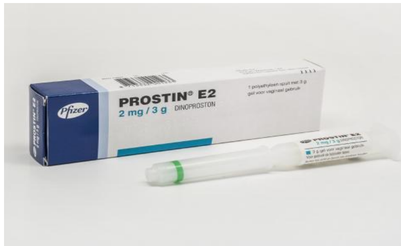
Slika 7. Prostin E2 vaginalni gel

Najčešće komplikacije prostaglandina koji se koriste za sazrijevanje vrata maternice i indukcije poroda su tahisistolija, hiperstimulacija maternice, fetalna bradikardija. Povezane su s dozom i rijetko se vide kod žena koje primaju male doze (0,5 mg). Manje učestale komplikacije koje su posljedica indukcije prostaglandina uključuju rupturu maternice, infarkt miokarda te emboliju plodovom vodom, koje su iznimno rijetke. (21)