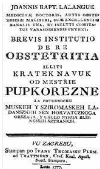
Slika 1. Naslovnica Lalanguove knjige „Brevisinstitutio de reobstetricia“ illiti „Krateknavuk od mestriepupkorezne“ Zagreb, Trattner 1777.

Primaljstvo je jedna od najstarijih medicinskih struka. U prošlosti su tijekom poroda skrb pružale priučene žene, koje su znanje stjecale iskustvom. Kasnije se pokazala nužna potreba za školovanjem primalja kako bi se pružila kvalitetnija skrb za roditelje i novorođenčad. (7) Prateći povijesni razvoj medicine i društva može se jasno vidjeti kako su zakonodavstvo, broj primalja i sama briga o ženama jedan od znakovitih pokazatelja razvoja određene sredine. Prve primaljske tečajeve u Hrvatskoj održavao je liječnik Ivan Krstitelj Lalangu koji je 1777. godine izdao prvi primaljski udžbenik za žene koje su se željele baviti primaljstvom, pod nazivom „Kratek navuk od meštrie pupkorezne” - to je prvi udžbenik za primalje napisan na hrvatskom jeziku. 1786. godine je otvorena prva, ujedno i najstarija škola za primalje u Rijeci, a vodio ju je Jakoba Cosmini. (8)