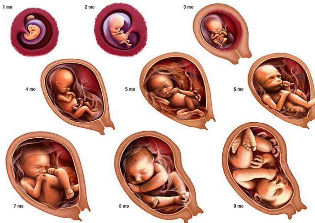
Slika 2. Faze razvoja fetusa