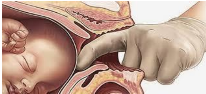
Slika3. Odljuštenje donjeg pola vodenjaka

Odljuštenje donjeg pola vodenjaka je najbolje proučena nefarmakološka metoda za sazrijevanje vrata maternice i indukciju poroda. Razna klinička ispitivanja pokazala su da odljuštenje donjeg pola vodenjaka uspješno izaziva porod. Međutim potencijalni rizici uključuju prerano pucanje vodenjaka, infekciju te krvarenje.