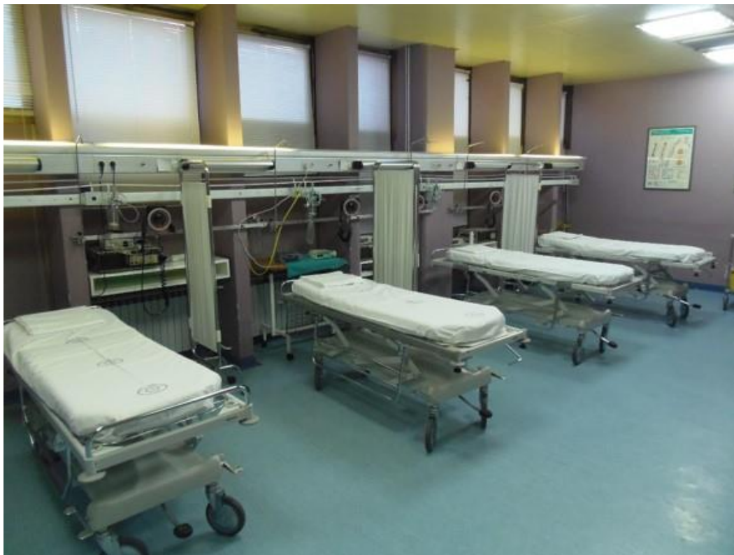
Slika 1. Soba za pripremu i buđenje iz anestezije Klinike za anesteziologiju, intenzivnu medicinu i liječenje boli u KBC-u Rijeka

povezane na sustav napajanja u nuždi. Standardni monitori kojima se nadzire stanje bolesnika u poslijeanestezijskom razdoblju su osnovni fiziološki monitori, a oni uključuju pulsnu oksimetriju (saturacija kisikom – SpO 2 ), elektrokardiografiju (EKG) i uređaj za neinvazivno mjerenje krvnoga tlaka te monitoring tjelesne temperature (4). Standardni monitori moraju imati integrirani alarm koji prepoznaje i signalizira odstupanja od optimalnih vrijednosti vitalnih funkcija te moraju imati mogućnost invazivnog mjerenja krvnoga tlaka. U PACU se također moraju nalaziti aspirator (uređaj za aspiraciju – sukciju), stimulator perifernih živaca, prijenosni defibrilator i kolica za oživljavanje koja su adekvatno opremljena te pribor za osiguravanje dišnog puta – orofaringealni i nazofaringealni tubus, laringoskop, endotrahealni tubus, laringealnu ili običnu masku te samošireći balon (4). Kirurška oprema, poput seta za torakalnu drenažu i traheotomiju, bi trebali biti dostupni u kriznim slučajevima. Ostala oprema koja bi trebala biti dostupna u jedinici poslijeanestezijske skrbi uključuju vrećicu pod pritiskom (za brzu nadoknadu volumena), pribor za uspostavu perifernog venskog puta i uzimanje uzorka krvi, grijaće deke, osnovnu opremu i alate (npr. standardnu opremu za osobnu zaštitu, sanitetski materijal, gaze, leukoplast, škare, stezaljke, set za šivanje, itd.) te odgovarajuće lijekove i infuzijske otopine.