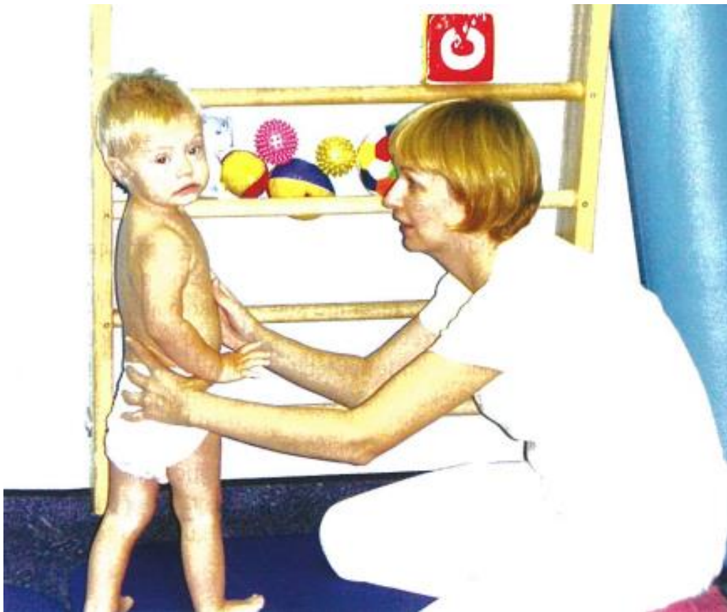
Slika 2: Neurorazvojna terapija po Bobath-u, stabilizacija trupa preko glavne ključne točke