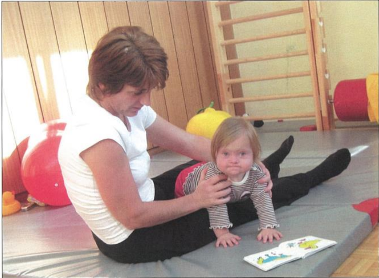
Slika 3: Razvoj četveronoškog položaja, iz tog položaja poticati prednje obrane

Izvor: Down sindrom 21, V.Čulić, S.Čulić, 2009.