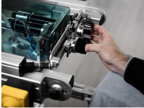
Slika 5. ReHaptic Knob