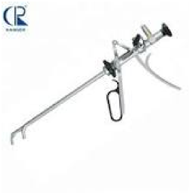
Slika 7 Cistoskop

Cistoskopija je dijagnostička metoda koja se obavlja uz lokalni anestetik pomoću optičkog metalnog instrumenta koji se naziva cistoskop (slika 7). Pretraga je važna jer cistoskopski pregled najuspješnije omogućuje uvećani pregled sluznice golim okom što je ujedno i prednost u otkrivanju zloćudnih bolesti.