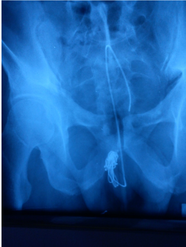
Slika 1 Rendgen slika kabela u urogenitalnom traktu