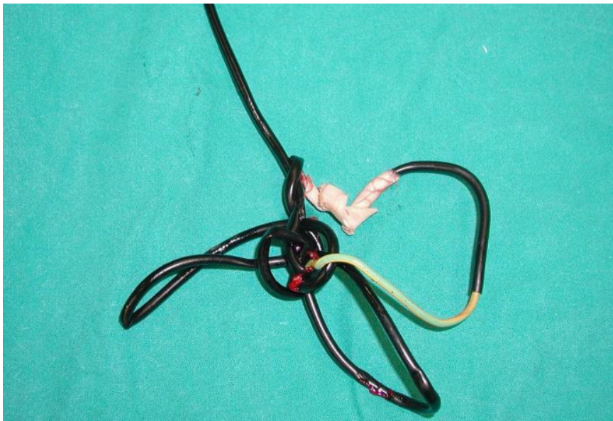
Slika 2 Slika kabela nakon izvlačenja iz urogenitalnog trakta