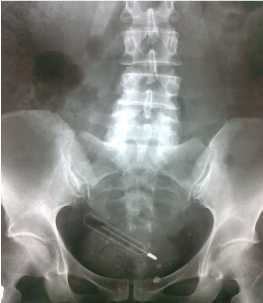
Slika 3 Rendgen slika toplomjera u urogenitalnom traktu