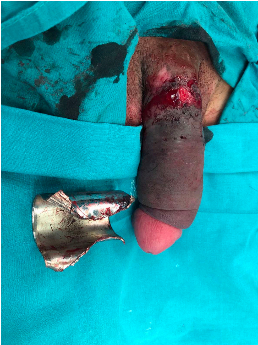
Slika 6 Potpuno skinuta metalna cijev