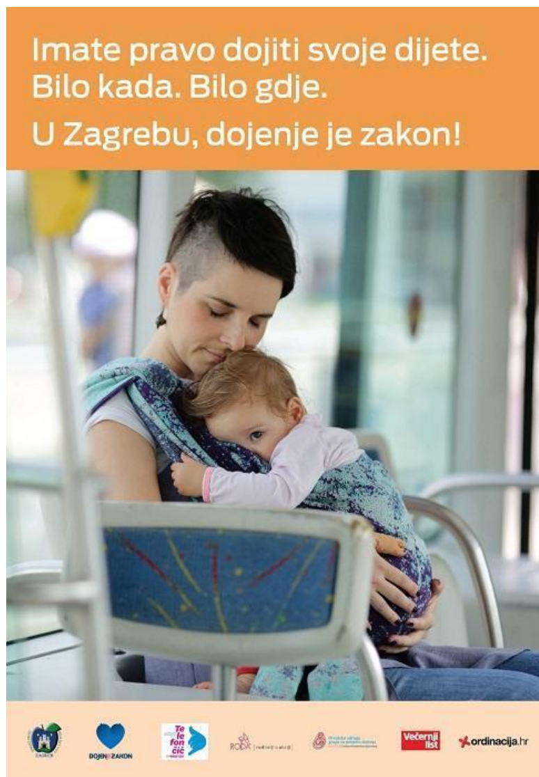
Slika 1. Primjer promotivne akcije s ciljem normaliziranja dojenja u javnosti. Izvor: Grad Zagreb. Imate pravo dojiti svoje dijete. Bilo kada. Bilo gdje. U Zagrebu, dojenje je zakon! [Internet]. Zagreb: Grad Zagreb; 2020. Dostupno na: https://www.zagreb.hr/imate-pravo-dojiti-svoje-dijete-bilo-kada-bilo-gdj/161792

postavljanja plakata (Slika 1. i 2.) (17,18). Unatoč tome što takva vrsta aktivizma doprinosi mijenjanju percepcije javnosti i dalje je dojenje u javnosti vrlo polarizirajuća tema (17).