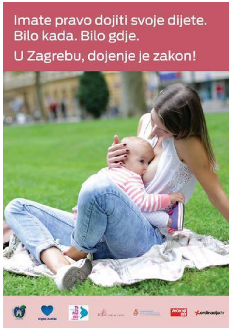
Slika 2. Primjer promotivne akcije s ciljem normaliziranja dojenja u javnosti.