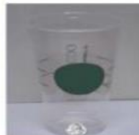
Srednje velika ledena kava, oko 500 ml (16 oz)