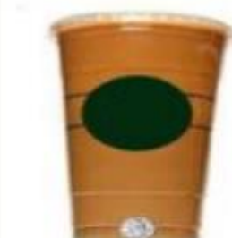
Jako velika ledena kava oko 900 ml (31 oz)

Konzumirate li gazirana pića najmanje jednom tjedno?