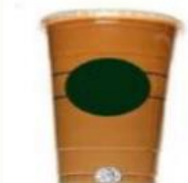
Jako velika ledena kava oko 900 ml (31 oz)

Konzumirate li gazirana pića najmanje jednom tjedno?