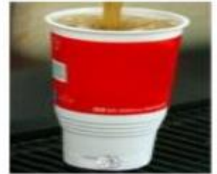
Limenka/boca oko 1 L (32 oz)

Konzumirate li energetska pića najmanje jednom tjedno?