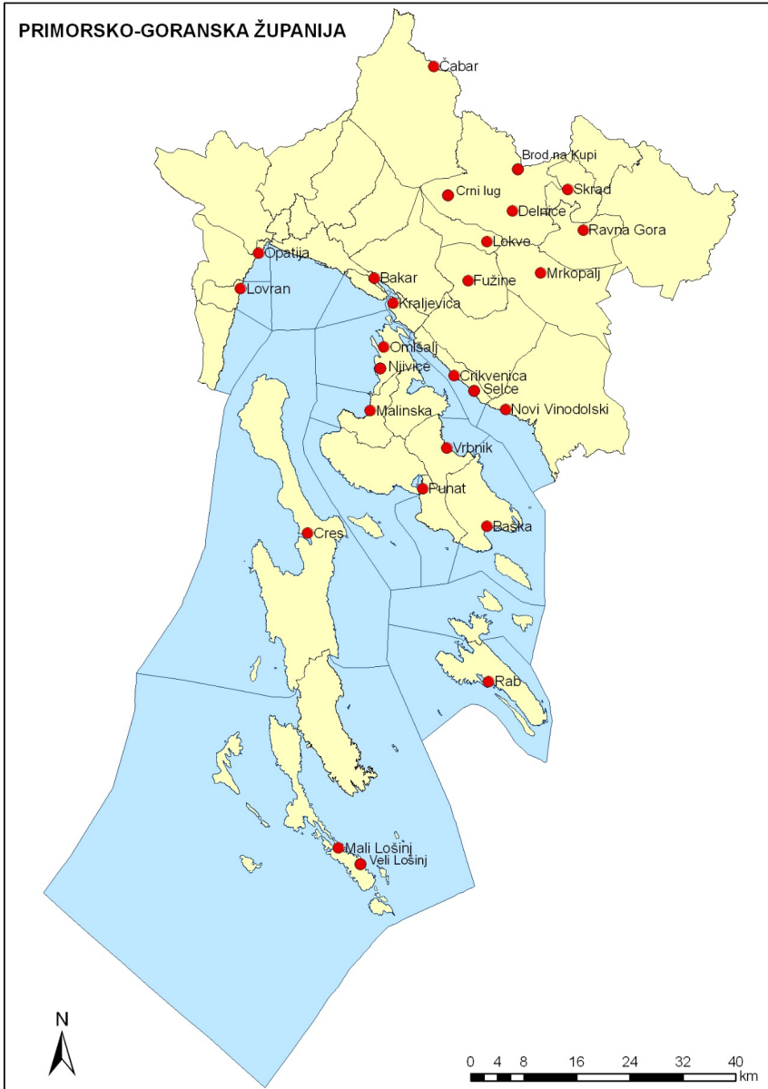
Slika 6. Lječilišna turistička mjesta u Primorsko-goranskoj županiji

Gorski kotar se može potencijalno razviti kao destinacija zdravstvenog i lječilišnog turizma, jer ima mogućnosti i dovoljno potencijala da se ovi specifični oblici turizma unaprijede i razviju.