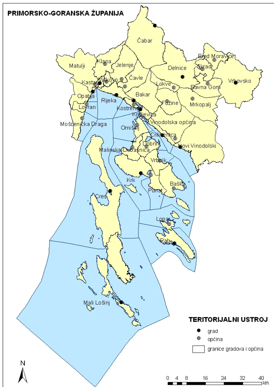
Slika 5. Teritorijalni ustroj Primorsko-goranske županije