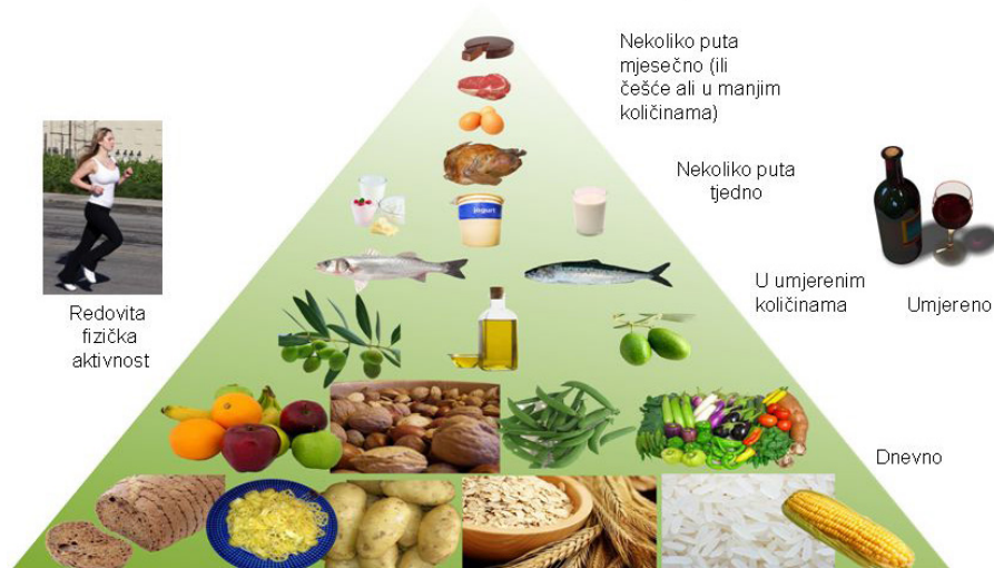
Slika 1. Piramida mediteranske prehrane