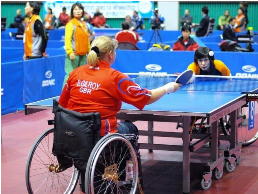
Slika 3. Para stolni tenis.

Igranje stolnog tenisa poboljšava izdržljivost i snagu, ravnotežu i koordinaciju igrača. Također ima antidepresivni učinak i pomaže u integraciji osoba sa invaliditetom a stalne inovacije u ovom sportu osiguravaju da osobe s invaliditetom mogu još više sportski napredovati te promicati duh inkluzivnosti.