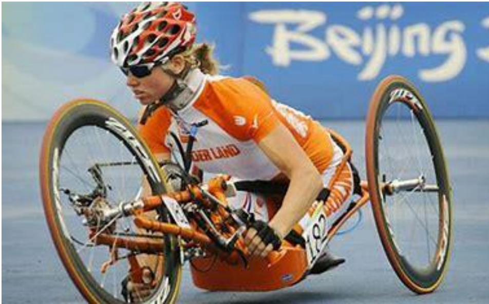
Slika 4. Biciklizam na ručni pogon.

sustav klasifikacije temeljen je na funkcijama sportaša te dopušta mješovita oštećenja unutar kategorije što znači da je moguće da se sportaš s lokomotornim oštećenjem natječe protiv sportaša koji ima poremećaj koordinacije. Svaka kategorija ima vlastiti skup pravila i prilagodbi opreme kako bi se prilagodila invaliditetu sportaša (55).