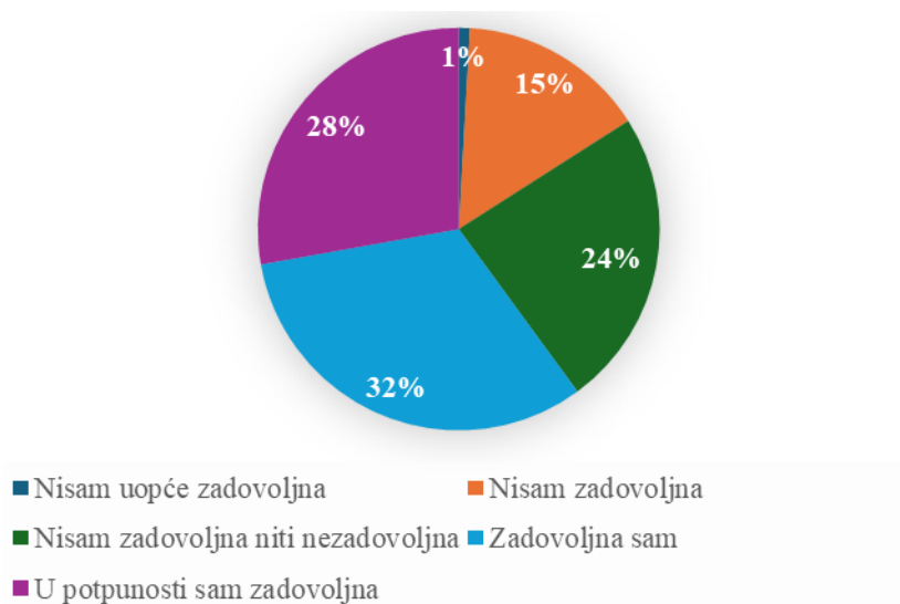
Slika 2. Stupanj zadovoljstva primaljskom skrbi

Ispunjavanjem anketnog upitnika, putem 19 pitanja baziranih na radu primalja ispitani su osobni stavovi prvorotkinja o zadovoljstvu pružene primaljske skrbi. Kako bi utvrdili zadovoljstvo primaljskom skrbi korištena je metoda frekvencijske analize, pomoću koje saznajemo kako je više od polovice prvorotkinja zadovoljno ili u potpunosti zadovoljno pruženom primaljskom skrbi. Ovi podaci prikazani su na grafičkom prikazu Slika 2.