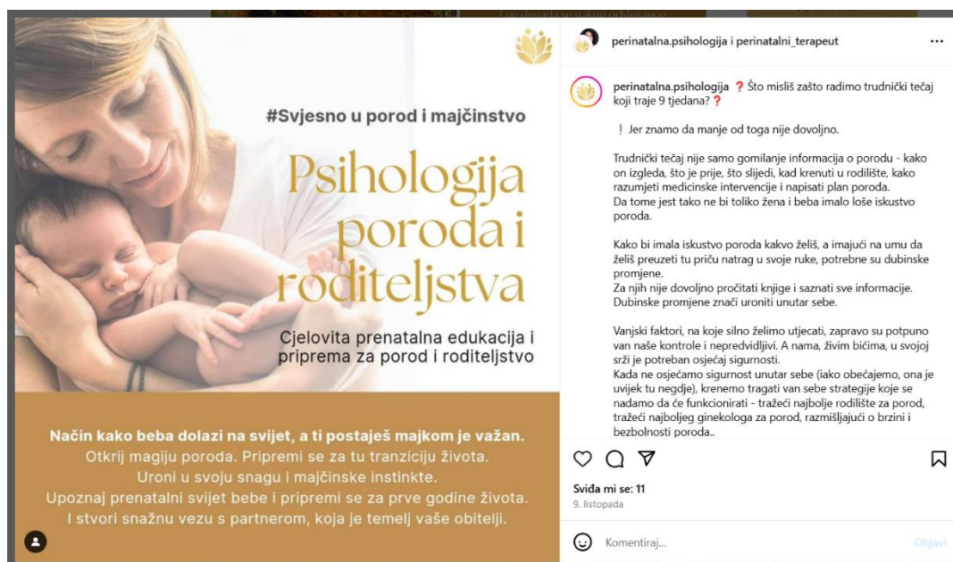
Slika 1. Oglas za trudnički tečaj

raznovrsni izvori omogućuju trudnicama pristup informacijama prema njihovim preferencijama i potrebama. Prema istraživanjima, trudnice se o trudničkim tečajevima najviše informiraju od prijateljice (51,43%), ginekologa i ostalog medicinskog osoblja (37,14%) dok je informiranje kroz medije najrjeđe (4,29%) (13).