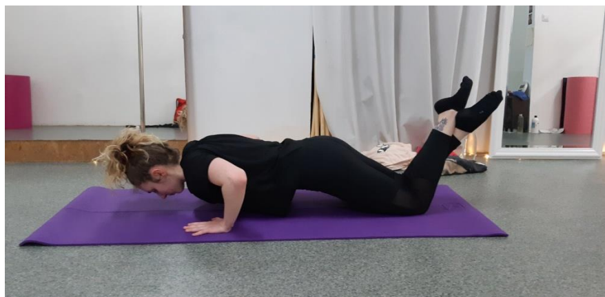
Slike 8. i 9. Prikaz pravilne izvedbe skleka na koljenima