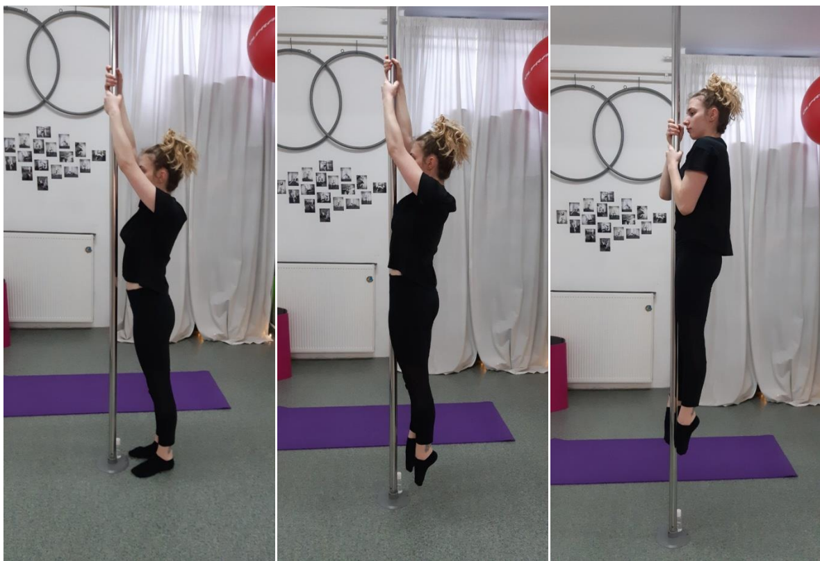
Slike 5., 6. i 7. Prikaz pravilne izvedbe zgibova na vertikalno postavljenoj šipci (Privatan izvor)

Putanja kretanja: Tijelo se kreće okomito gore. Ključno je izbjegavati njihanje, trzanje ili „kljucanje bradom“.