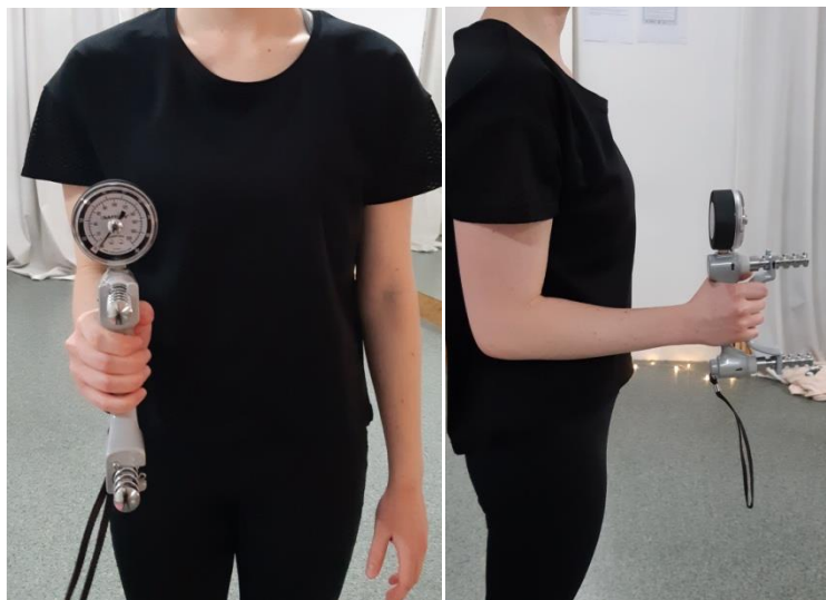
Slike 3. i 4. Prikaz pravilne izvedbe testa stiska šake dinamometrom

Izvedba testa: Ispitanik pokušava stisnuti dinamometar uz maksimalan izometrički trud bez pomicanja tijela ili odmicanja ruke od trupa. Ispitanik pokušava zadržati stisak otprilike 5 sekundi. Test se izvodi 3 puta na svakoj ruci. Bilježi se najbolji rezultat.