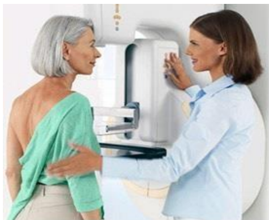
Slika 2 Prikaz žene starije životne dobi na na screeningu za rak dojke - mamografija

Preventivna metoda kojom se pokušava otkriti maligna bolest u što ranijoj fazi. Ona sadrži opće pretrage, primarno slikovne, kako bi se u ciljanoj populaciji (ljudi koji imaju