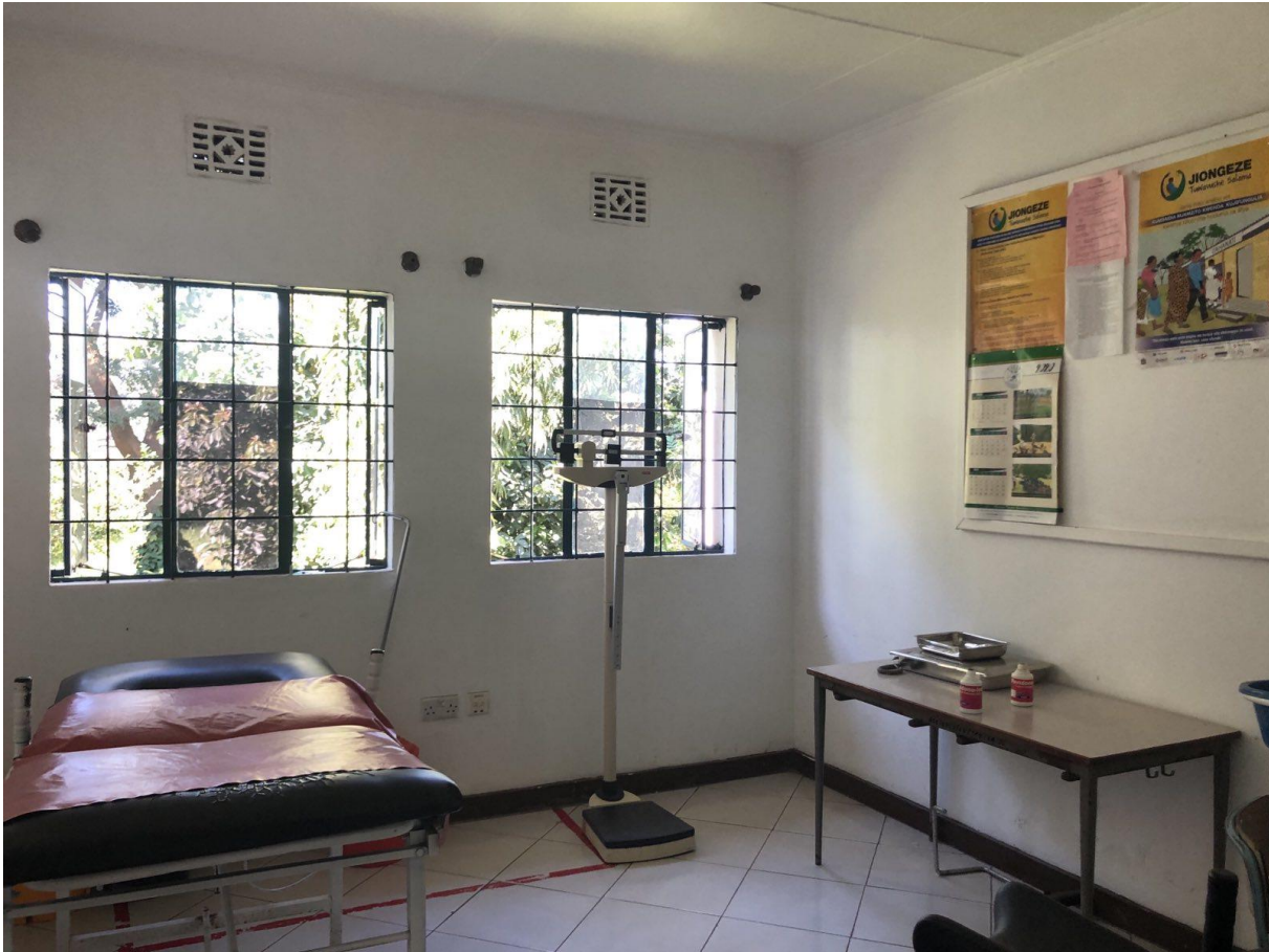
Slika 2. Prijemna ambulanta u LHCC-u, Arusha, Tanzania

Kod prijema se obavlja vaginalni pregled, određuje se namještaj i položaj ploda Leopold – Pavlikovim hvatovima (LP hvatovi), mjeri se tlak, tjelesna težina, udaljenost fundusa i simzife te opseg trbuha. KČS slušaju se Pinardovom slušalicom.