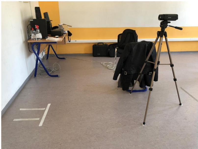
Slika 2: Pozicija termo kamere za snimanje ispitanika

Prije mjerenja termografijom, ispitanicima je izmjerena visina, masa, puls, zasićenost kisikom te opseg mišića dominantne i nedominantne ruke. Na temelju izmjerene visine i težine izračunat je BMI za svakog ispitanika. Također, prije mjerenja termo kamerom, ona je kalibrirana na temperaturu prostorije koja je iznosila 20°C. Termo kamera je postavljena na visinu od 120cm, a ispitanici su stajali na udaljenosti od 140cm od leće termo kamere. Kako bi svi ispitanici stajali na istom mjestu, na podu su uz pomoć ljepljive trake povučene crte na kojima su ispitanici trebali stajati (slika 2).