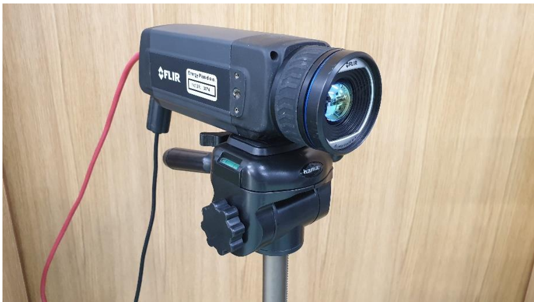
Slika 1: Termo kamera FLIR A615

Metoda koja je korištena u istraživanju je termografija. Termografija je metoda kojom se termo kamerom, neinvazivno, mjeri temperatura mišića u mirovanju, ali i tijekom aktivnosti. Termo kamera koja je korištena u ovom istraživanju je FLIR A615 termalne rezolucije 640 x 480 termo piksela (slika 1).