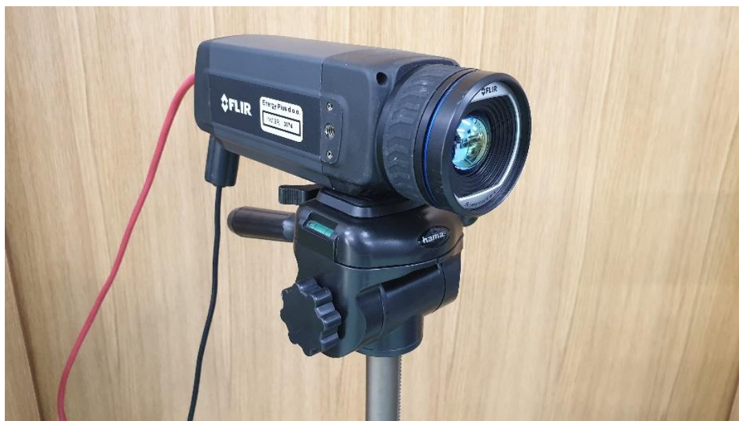
Slika 1: Termo kamera FLIR A615

Metoda koja je korištena u istraživanju je termografija. Termografija je metoda kojom se termo kamerom, neinvazivno, mjeri temperatura mišića u mirovanju, ali i tijekom aktivnosti. Termo kamera koja je korištena u ovom istraživanju je FLIR A615 termalne rezolucije 640 \times 480 termo piksela (slika 1).