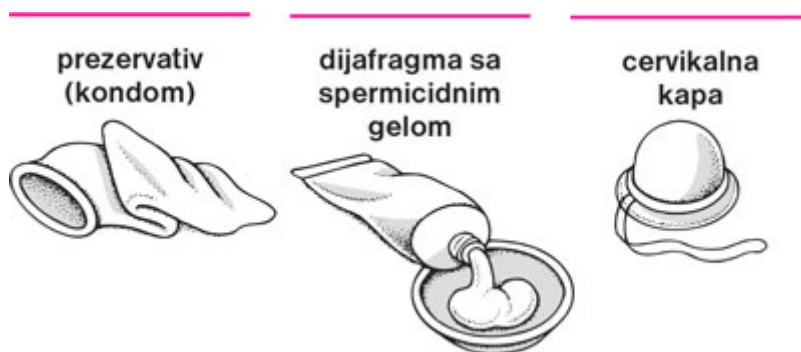
Slika4. Mehanička kontracepcija za zaštitu od neželjene trudnoće

POLIURETANSKA VREĆICA – prije početka odnosa postavlja se u vaginu (kemijska i mehanička zaštita).