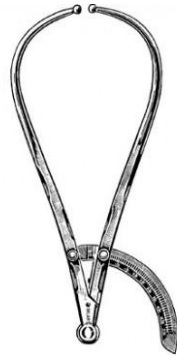
Slika 2. Prikaz pelvimetra po Martinu

Osim unutarnjih mjera zdjelice od velike su važnosti i vanjske mjere zdjelice koje nam mogu pomoći u prepoznavanju zdjelice uskog ili nepravilnog oblika. Mjerne točke su lat. distantia spinarum kojom se gleda udaljenost između lat. spina iliaca anterior superior i ona iznosi 25-26 cm, zatim lat. distantia cristarum , odnosno udaljenost između lat. crista iliaca koja iznosi 28-29 cm, lat. distantia trochanterica ili udaljenost između lat. trochantera femura koja iznosi 32-33 cm te lat. conjugata externa kojom se gleda udaljenost od gornjeg ruba simfize do 5.lumbalnog kralješka i ona iznosi 20 cm. Za mjerenje vanjskih mjera zdjelice koristi se šestar po Martinu, odnosno pelvimetar (slika 2).