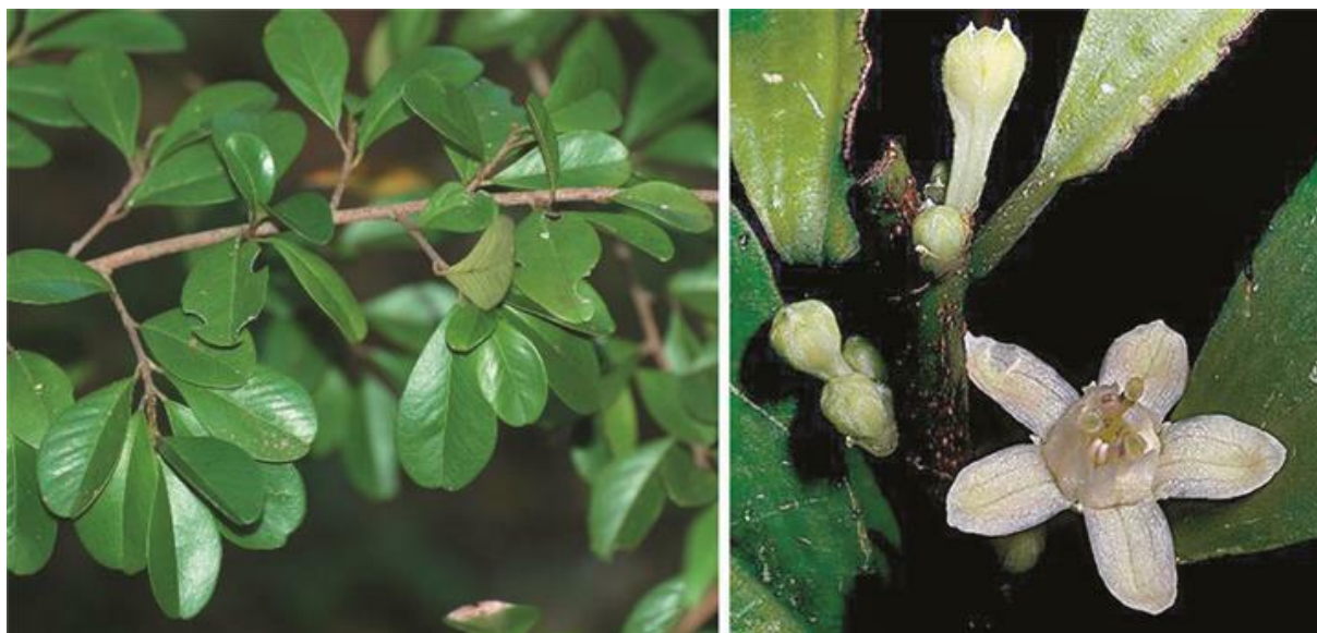
Slika 3. Prikaz Erythroxylon coce

koji se dobiva sintetskim putem. Može biti transnazalan put upotrebe, peroralan, parenteralan ili pušenjem.