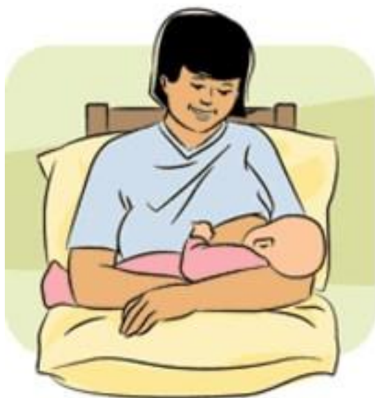
Slika 3. Položaj koljevke

Pri položaju koljevke se dijete drži u naručju, no pritom ruka mora biti rasterećena, tj oslonjena na jastuk. Ako dijete siše na desnoj dojci, položeno je na desnu ruku i obrnuto. Leđa također moraju imat dobar oslonac kako bi se izbjegli bolovi, nije potrebno savijanje prema naprijed ni prema nazad (osim prilikom snažnog refleksa otpuštanja mlijeka). Dijete mora biti cijelom ravninom okrenuto prema majci, a ne samo glava.