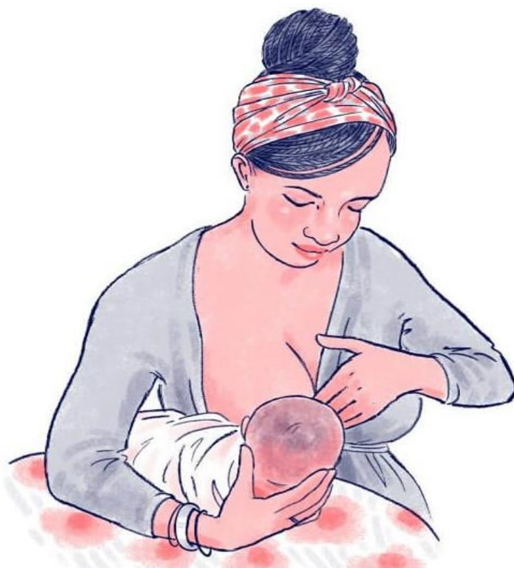
Slika 6. Položaj nogometne lopte

Položaj nogometne lopte sličan unakrsnom hvatu, dijete se nalazi bočno od majke na jastuku – „pod rukom“, nos mora bit u ravnini bradavice. U ovom položaju se lakše stječe uvid u pravilan prihvat dojke. Povoljan položaj za bolje pražnjenje dojki, tj. kanalića s vanjske strane. Također je povoljan položaj za majke s većim prsima, za dojenje prijevremeno rođene djece i za majke koje su rodile carskim rezom.