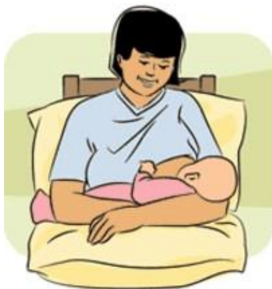
Slika 3. Položaj koljevke

Pri položaju koljevke se dijete drži u naručju, no pritom ruka mora biti rasterećena, tj oslonjena na jastuk. Ako dijete siše na desnoj dojci, položeno je na desnu ruku i obrnuto. Leđa također moraju imat dobar oslonac kako bi se izbjegli bolovi, nije potrebno savijanje prema naprijed ni prema nazad (osim prilikom snažnog refleksa otpuštanja mlijeka). Dijete mora biti cijelom ravninom okrenuto prema majci, a ne samo glava.