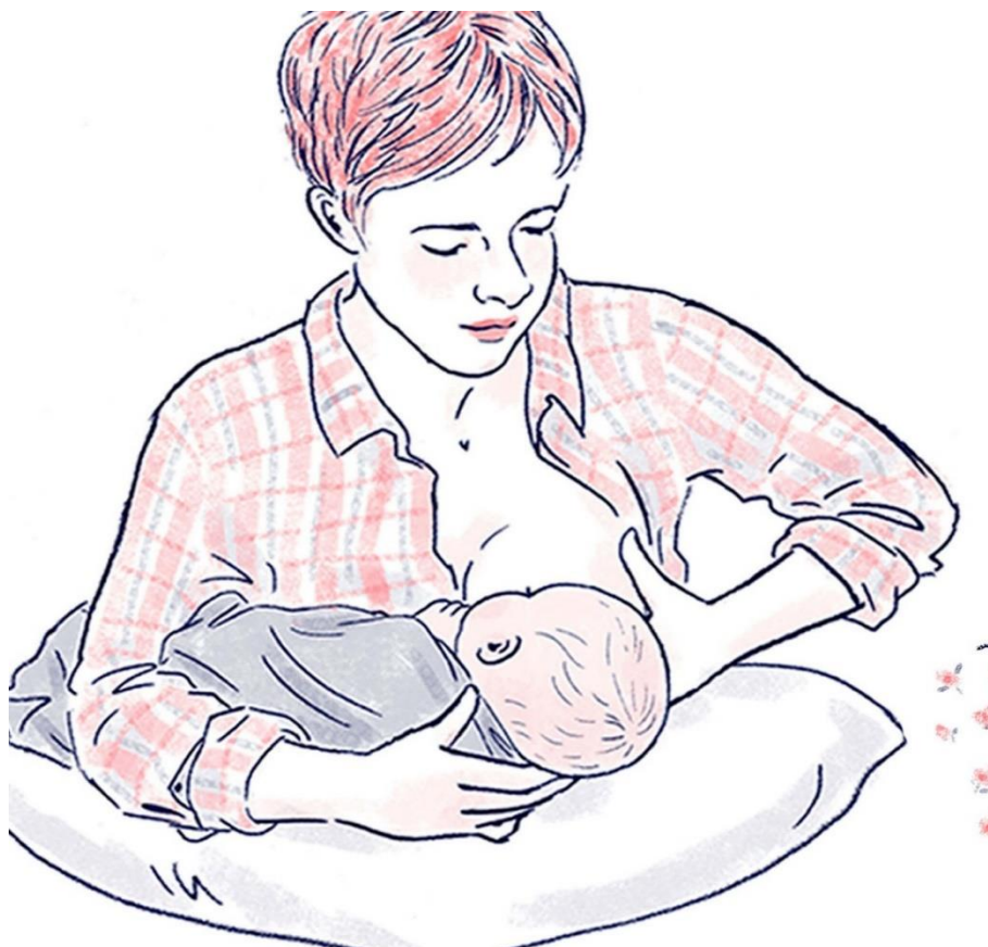
Slika 4. Unakrsni hvat

Unakrsni hvat se također izvodi u položaju kolijevke, jedino su uloge ruku zamijenjene. Dijete siše na desnoj dojci, glava se pridržiava lijevom rukom a dojka desnom kako bi se lakše namjestilo dijete i pridržiavala dojka, lakši je uvid u prihvat dojke.