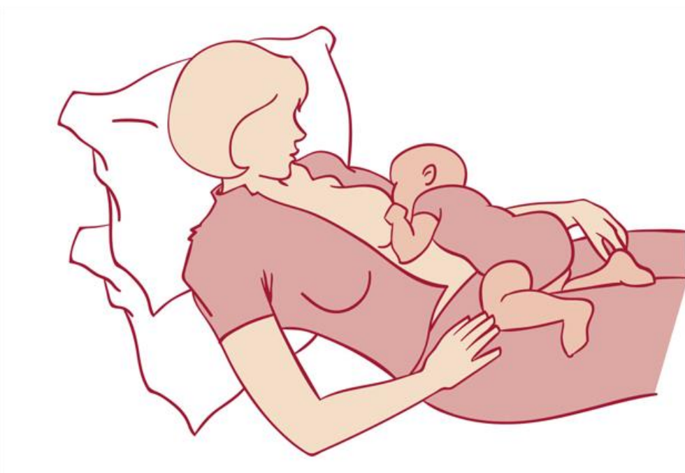
Slika 5. Biološki položaj

Biološki položaj tijekom podoja koristan je kod carskog reza i uvučenih bradavica. Žena je smještena udobno u poluležeći položaj, ruke su joj poduprte jastucima te je dijete cijelim prednjim dijelom tijela u dodiru s majkom. Gravitacija drži dijete te su ženi ruke slobodne što znači da nema dodatnog umaranja i naprezanja (41,43).