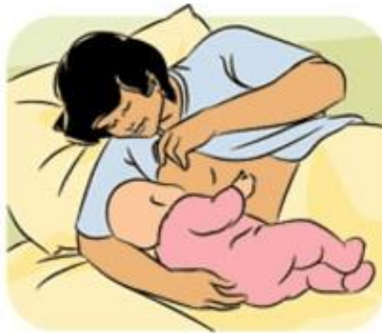
Slika 2. Ležeći položaj na boku

U rodilištu gotovo sve majke doje u ležećem položaju na boku, što je tada u toj situaciji najjednostavniji položaj. Kako bi ženi bilo što udobnije može staviti jedan jastuk između koljena, a novorođenče se također može podbočiti jastukom.