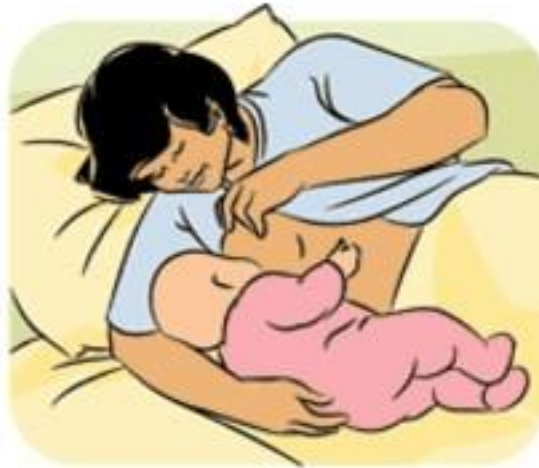
Slika 2. Ležeći položaj na boku

U rodilištu gotovo sve majke doje u ležećem položaju na boku, što je tada u toj situaciji najjednostavniji položaj. Kako bi ženi bilo što udobnije može staviti jedan jastuk između koljena, a novorođenče se također može podbočiti jastukom.