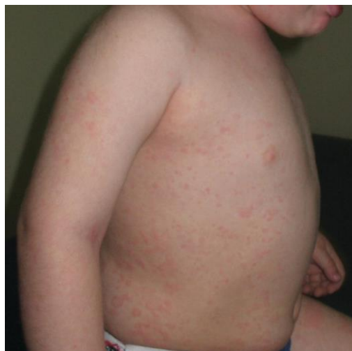
Slika 3 - osip karakterističan za sistemska JIA, preuzeto sa https://link.springer.com/chapter/10.1007/978-3-319-96929-9_13

Sistemska JIA može prethoditi artritisu tjednima i mjesecima ili rijetko godinama, odnosno najčešće se primarno razvija groznica i karakterističan osip, a kasnije artritis zahvaća velike i male zglobove. Najistaknutija značajka sistemske JIA je povišena tjelesna temperatura koja obično raste do 39 °C ili više, nekoliko puta dnevno nakon čega slijedi povratak na normalnu temperaturu. Povišenu tjelesnu temperaturu gotovo uvijek prati specifičan osip, koji je prolazan te obično dolazi i odlazi s skokovima tjelesne temperature i sastoji se od diskretnih, ograničenih, ružičastocrvenih mrlja koje mogu biti okružene blijedim prstenom. Osip je najčešće na trupu i proksimalnim ekstremitetima, uključujući pazušne i ingvinalne dijelove, ali se može razviti i na licu, dlanovima ili tabanima, a ima tendenciju migriranja (45,46).