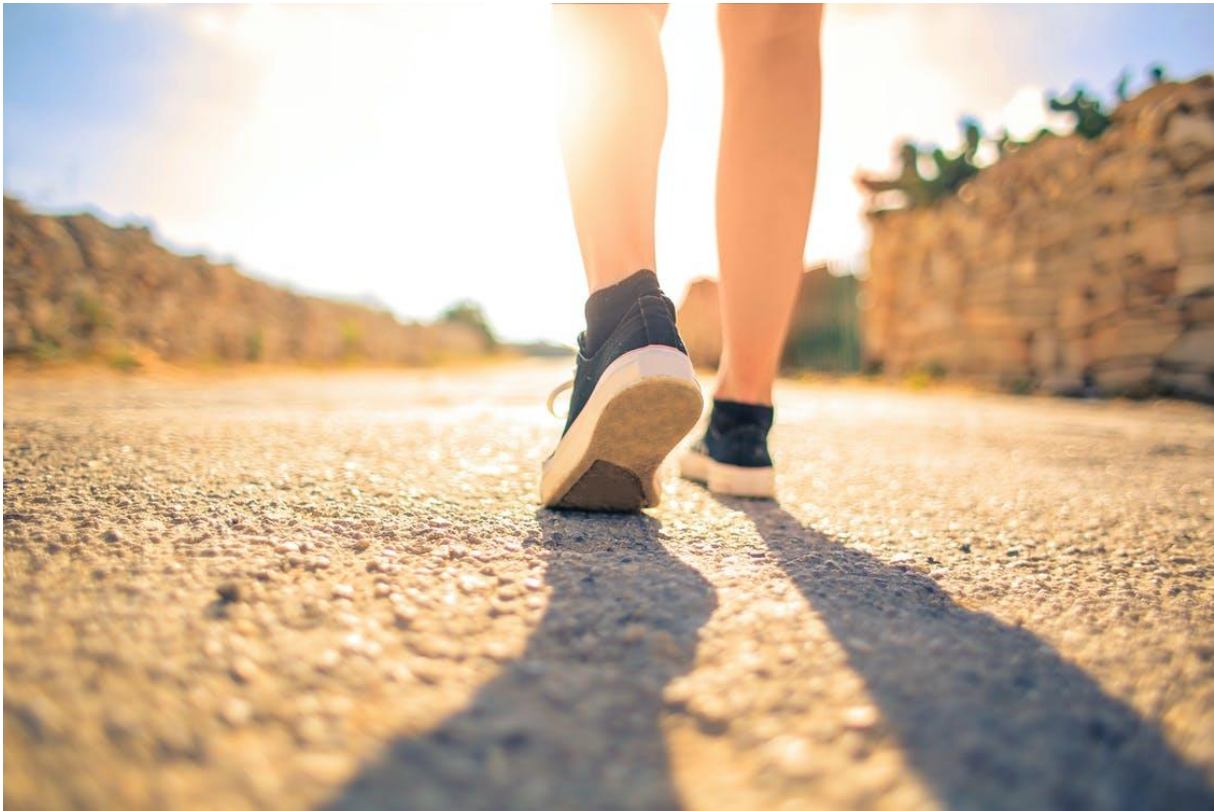
Slika 6. Tjelesna aktivnost smanjuje rizik od obolijevanja od raka dojke; Izvor: https://www.pexels.com/photo/woman-walking-on-pathway-under-the-sun-3779751/

ne mogu same biti pouzdane za upravljanje zdravim životom pacijenta zato što je tjelesna aktivnost jako varijabilan pojam kojeg karakteriziraju različite pogreške, te utjecaji činitelja različitog tipa.