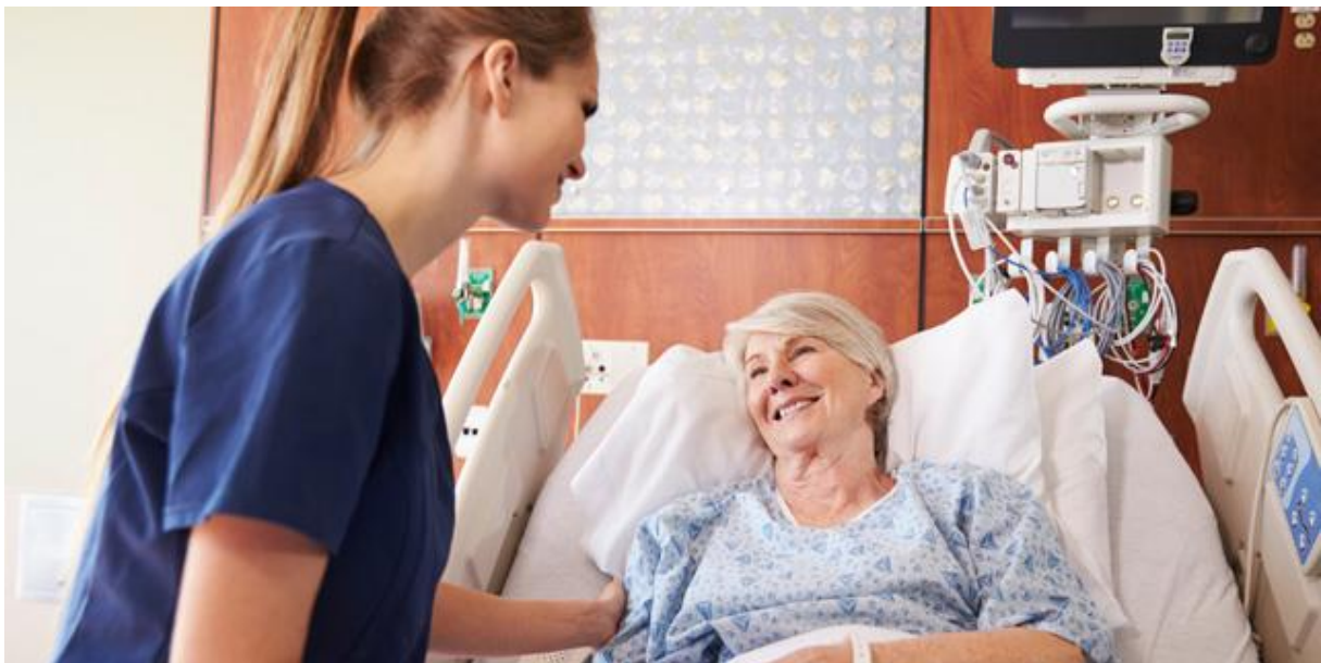
Slika 5. Uloga medicinske sestre u holističkom načinu liječenja karcinoma dojke

Najbitnije je u ovoj fazi primijeniti zadovoljavajuću edukaciju članova obitelji, okoline, prijatelja, partnera i sl. Uglavnom onoga tko se brine i tko je u neposrednoj vezi sa bolesnicom. Na taj način se i sprječavaju negativne, uglavnom psihološke prirode, posljedice ako je potrebno u svrhu poboljšanja općeg zdravstvenog stanja bolesnice ili čak i njezinog izlječenja, napraviti mutilaciju dojke ili nekih njezinih dijelova.