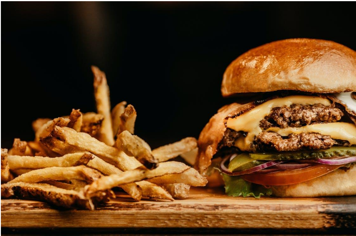
Slika 4. Masna i pržena hrana često sadrži kancerogene spojeve

Različita istraživanja potvrdila su i tezu da kvaliteta prehrane utječe na razvoj karcinoma dojke. Prehrambeni činitelji utječu na 20%, a u razvijenim zemljama čak i na 60% ukupne učestalosti samog karcinoma (5). Hrana sadrži brojne kancerogene i potencijalno kancerogene tvari koje se unose u organizam.