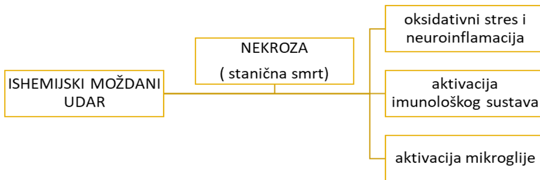
Slika 2 - patofiziološki procesi ishemijskog moždanog udara