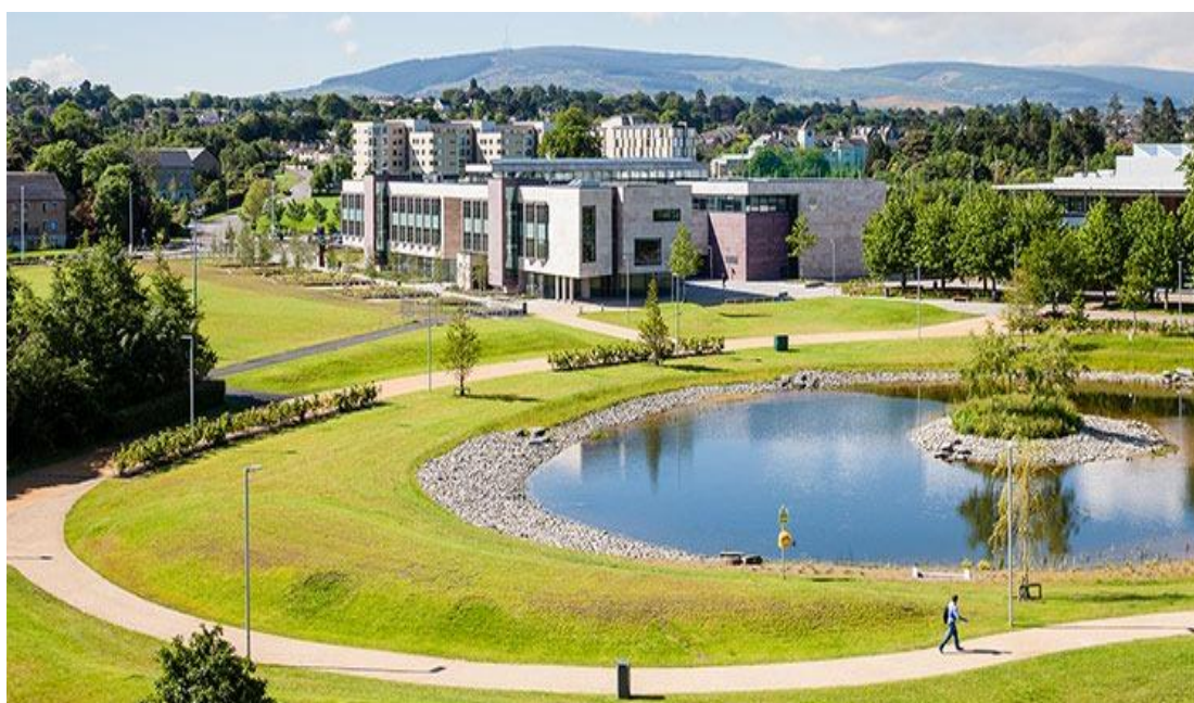
Slika 5. Sveučilišni koledž Dublin

Sveučilište Dublin (UCD) ili Sveučilišni koledž Dublin je javno istraživačko sveučilište i član Nacionalnog sveučilišta Irske. Sa čak 33 284 studenta to je najveće irsko sveučilište i jedno od najprestižnijih sveučilišta u zemlji. UCD potječe iz tijela osnovanog 1854. godine koje je osnovano kao katoličko sveučilište u Irskoj. Izvorno je smješteno na St. Stephen's Green u središtu grada Dublina, no svi su se fakulteti od tada preselili na kampus u Belfieldu, 4 kilometra južno od središta grada. Sastoji se od 6 koledža (10).