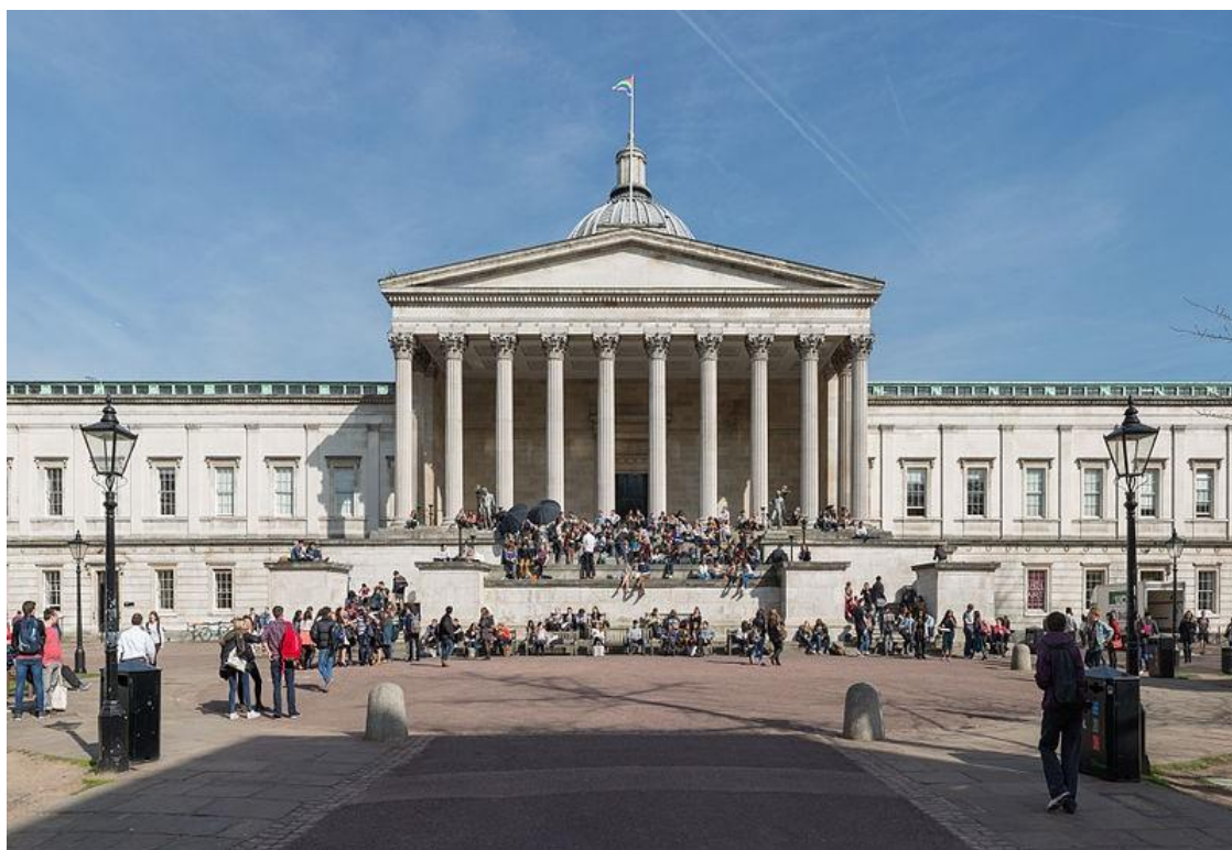
Slika 4. Wilkins zgrada Sveučilišnog koledža u Londonu