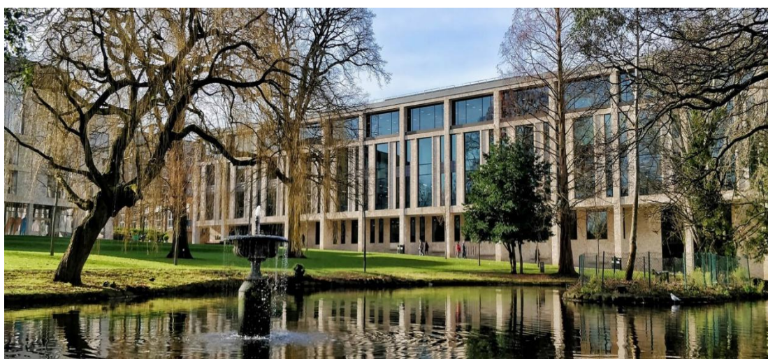
Slika 3. Sveučilišna knjižnica Sveučilišta u Roehamptonu

Sveučilište u Roehamptonu je javno sveučilište u Ujedinjenom kraljevstvu i nekadašnji je Institut za visoko obrazovanje Roehampton. Postaje samostalno sveučilište 2004. godine kada se odvaja od Federalnog sveučilišta Surrey i od 2011. godine nosi ime Sveučilište Roehampton. Sastoji se od četiri fakulteta, osam odjela i tri škole, a dio je Europskog sveučilišnog udruženja. (eng. European University Association) (6).