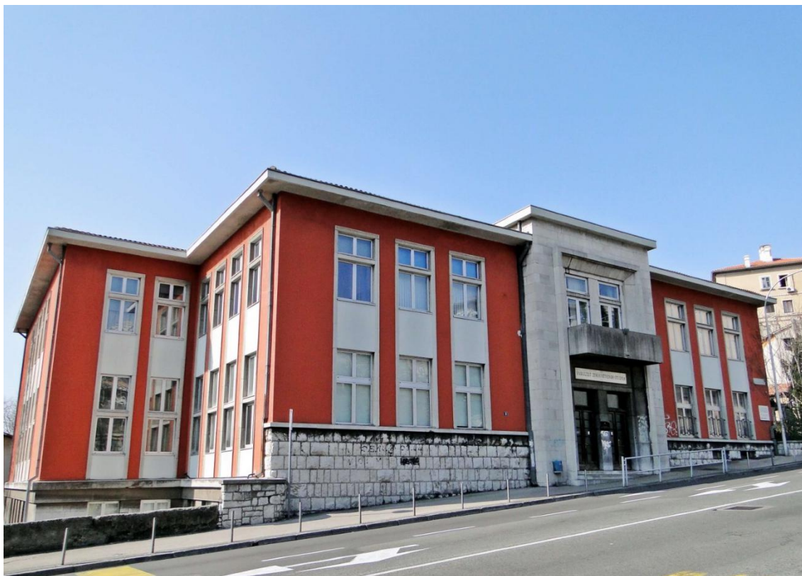
Slika 2. Zgrada Fakulteta zdravstvenih studija Sveučilišta u Rijeci

Sveučilišni diplomski studij kliničkog nutricionizma osmišljen je prema uzoru na europske studije koji već niz godina obrazuju i u europskim zdravstvenim centrima uspješno zapošljavaju nutricionističke stručnjake. Trajanje studija iznosi dvije godine tijekom kojih student mora ostvariti 60 ECTS bodova. Svake studijske godine potrebno je ostvariti 60 ECTS bodova polaganjem obveznih i izbornih kolegija.